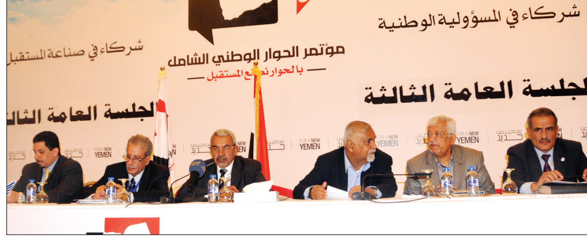
من الجلسة العامة الثالثة لمؤتمر الحوار الوطني أمس

طائفية وحروب داخلية .. طالب بيان حزب الرشد اليمني بأن تنزل اللجنة المكونة من لجنة التوفيق وآخرين يختارهم مؤتمر الحوار الوطني من جميع المكونات في الحوار إلى مباح الجيف الجميع على الحقيقة كما طالب بنزول وزير الدفاع والداخلية للإطلاع الميداني على الوضع والأخذ بقوة الدولة على المعتدي وبسط نفوذها على جميع المناطق وضبط المعتدي من أي جهة كانت . هذا وقد أعلن الدكتور العامري تعليق مشاركة الحاد الرشد اليمني في أعمال الجلسة العامة لمجلس أمن وبنية جلسات هذا الأسبوع . وقد علق نائب رئيس مؤتمر الحوار الوطني الدكتور ياسين سعيد نعمان على البيانات التي تليت بالتأكيد على أن اليمن مليئة بالمشاكل والمؤتمر يبحث عن حل لهذه المشاكل . وطالب الأعضاء بعدم نقل هذه المشاكل إلى داخل مؤتمر الحوار، محذراً من استقطاب هذا المؤتمر في إطار هذه المشاكل الماثرة في مجتمعنا كون ذلك لا يمكننا من التعامل معها وإيجاد الحلول لها .