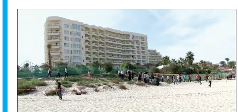
فندق بمنتمتع سوسة السياحي في تونس

تونس /متابعات: أعلنت وزارة الداخلية التونسية عن إيقاف 5 متورطين في حادثة سوسة والمنستير . وقالت في بيان رسمي لها: "تمكنت الوحدات الأمنية المختصة في وقت وجيز من القبض على 5 عناصر إرهابية كانت على علاقة مباشرة بالعنصرين الإرهابيين اللذين حاولا صباح أمس تنفيذ عمليتين إرهابيتين بكل من سوسة والمنستير . وشكل الهجوم الانتحاري قرب فندق بمنتمتع سوسة السياحي في تونس، الذي لم يسفر عن سقوط ضحايا غير الانتحاري نفسه، بحسب مصادر رسمية. وما أعلنت عنه السلطات من إحيائها هجوماً انتحارياً على ضريح الرئيس الراحل الحبيب بورقيبة في مدينة المنستير، تطوراً نوعياً في نسق العمليات الإرهابية التي تستهدف تونس منذ مطلع العام الحالي . فبعد أن اجتاحت البلاد موجة من التهديدات الإرهابية بالتنصيف الجسدية راح ضحيتها قياديان في المعارضة التونسية هما شكري بلعيد (فبراير 2013) ومحمد البراهمي (يوليو 2013) خسائر كبيرة بعد أن أقدم عشرات السياح