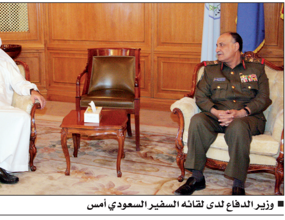
■ وزير الدفاع لدى لقائه السفير السعودي أمس

■ صنعاء / سبأ: التقى وزير الدفاع اللواء الركن محمد ناصر أحمد أمس سفير المملكة العربية السعودية الشقيقة بصنعاء علي بن محمد الحمدا . وخلال اللقاء تم استعراض ويحث عدد من القضايا وأوجه التعاون العسكري القائم بين الجيشين اليمني والسعودي بما يعزز جوانب الشراكة والتعاون العسكري بينهما. كما تم التباحث حول الاستعدادات الجارية لتنفيذ المناورة العسكرية المشتركة وفاق (2) لوحدات رمزية من الجيشين اليمني والسعودي والخطوات الرئيسية لتنفيذها. وأشاد وزير الدفاع بدعم ومساندة الأشقاء