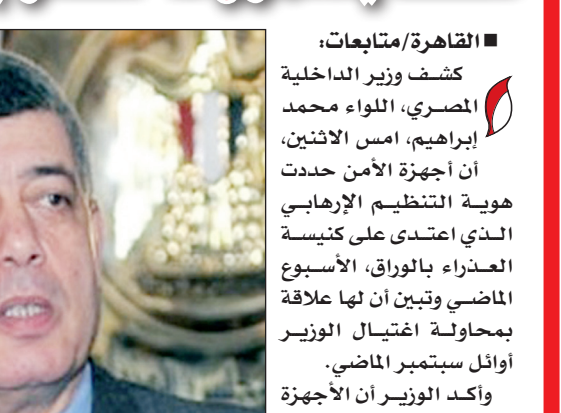
■ محمد إبراهيم وزير الداخلية المصري

من جهة أخرى، داهمت أجهزة الأمن بالجيزة منزلي اثنين من المشتبه بهم في حادث كنيسة الوراق ولم تعثر عليهما. وقامت قوات الأمن بوضع خطة محكمة للقبض على المشتبه بهم، عن طريق نشر لكتمة في أماكن مختلفة بالتنزامن مع رصد تحركات بعض المشتبه بهم. كما تعمل قوات الأمن على فحص ملفات عدد من العناصر المسلحة بمناطق الوراق الحضر وجزيرة الوراق، وجزيرة محمد وقرية طناش، وعزبة المفتي، الذين أفرج عنهم مرسى عقب توليه الحكم.