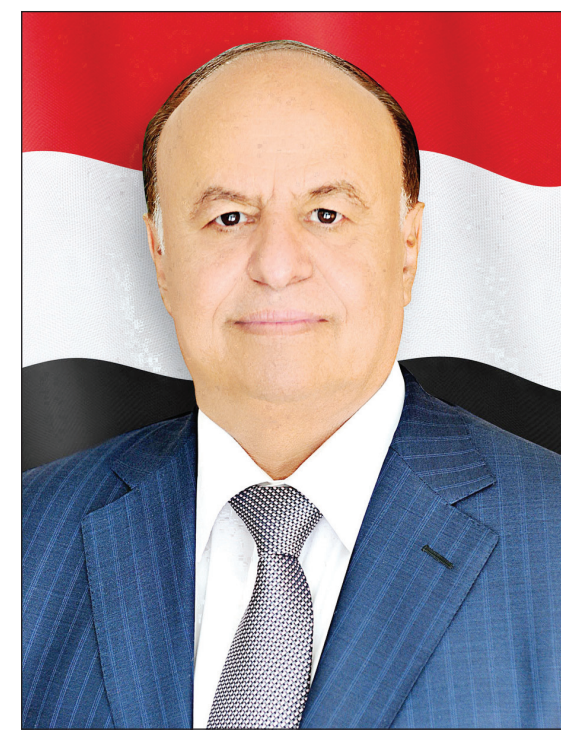
■ صنعاء / سبأ: بعث الأخ الرئيس عبد ربه منصور هادي رئيس الجمهورية برقية تهنئة إلى الرئيس عبد الله غل رئيس الجمهورية التركية بمناسبة احتفالات الشعب التركي بالعيد الوطني.