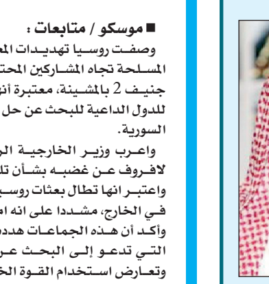
■ الشيخ عبدالعزیز آل الشيخ

■ الرياض / متابعات: انتقد مفتي السعودية الشيخ عبدالعزیز آل الشيخ الدعاء الذي يجرّضون الشباب على الذهاب إلى الجهاد بينما يمنعون أبناءهم عنه، مؤكداً أنهم يزرّجون بهؤلاء الشباب في الهاوية. وكان أحد الدعوات حرض عبر شبكات التواصل الاجتماعي، مؤخراً، على الجهاد في سوريا قبل أن يتجه إلى أوروبا لقضاء إجازته السنوية، وكان قد سبقه آخر بجواز القتال في العراق، وعندما علم ابنه طلب من السلطات السعودية رده بأسرع وقت. بينما حرض ثالث على القتال في سوريا وعندما سُئل عن أبنائه ولمّا إذا لا يذهبون قال إنهم يجاهدون بجمع المال، وهناك داعية آخر قد طالب معتصمي رابعة العدوية بالصمود وتحمل الشقاء فيما كان يتنقل هو بين عواصم العالم يلقي محاضرات عن تطوير الذات ويقوم ولادته في أميركا. وفي هذا الشأن قال الباحث الشرعي الدكتور أحمد الغامدي خلال استضافته في «شجرة الرابعة» على قناة «العربية»، أمس الاثنين، إن هذا الانتقاد من مفتي المملكة «متزن وعاقل، حيث خاطبهم بما يطالبون به الناس». وأضاف أن هؤلاء الدعاء منقسمون إلى ثلاثة وهم: إما متهورون ومندفعون، أو أصحاب أجندات يريدون تنفيذها، أو مقلدون لا يفقهون. وشدد الغامدي على ضرورة محاسبة ومحكمة هؤلاء الدعاء من قبل ولي الأمر، لأن ما قاموا به يؤدي إلى فتنة كبيرة وانقسام داخل