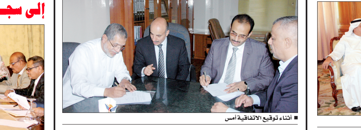
■ أثناء توقيع الاتفاقية أمس

■ صنعاء / سبأ: وقع أمس بوزارة الأشغال العامة والطرق على اتفاقية تنفيذ مشروع جسر ابن سينا ووادي حلة بحضور موت يبلغ طوله 300 متر بكلفة إجمالية تزيد عن 9 ملايين دولار والذي سيتم تنفيذه من قبل المؤسسة العامة للطرق والجسور . ويهدف المشروع الذي تم التوقيع عليه بحضور وزير الأشغال العامة والطرق المهندس عمر عبدالله الكرشمي ومحافظ حضرموت خالد سعيد الديني إلى تسهيل حركة سير المواطنين وفك الحصار عنهم أثناء الفيضانات .