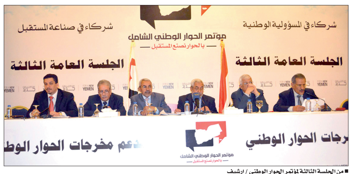
■ من الجلسة الثالثة لمؤتمر الحوار الوطني