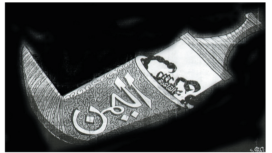
الكاريكاتير المنشور في صحيفة الاتحاد الاماراتية

المترامية الأطراف؛ وحتى يؤكد رسام ذلك الكاريكاتير المسيء لبلادنا وللسياحة فيها بأن تنظيم القاعدة يعني وأن مركزه اليمن قام برسم (عقرب سوداء مكتوب عليها بالأبيض (القاعدة) تخرج تلك العقرب من غمد تلك الجنبية التي نسبها ذلك الرسام لليمن) وتتأسى رسام ذلك الكاريكاتير بأن القاعدة تنظيم إرهابي عالمي قبل أن يبدأ في أفغانستان وباكستان وقبل أن ينتشر إلى جميع أنحاء العالم وعانت من هذه التنظيم معظم الدول المتقدمة والنامية والمتخلفة ومنها بلادنا.. وحتى لا تؤثر تلك الصحفية التي نشرت ذلك الرسم الكاريكاتيري المسيء لبلادنا على علاقة بلادنا الوثيقة والوطيدة والممتازة مع الدولة التي تخرج منها صحيفة (الاتحاد) فقد قامت بكتابة (وجهات نظر) فوق ذلك الرسم الكاريكاتيري، أي أن هذا الرسم لا يعبر إلا عن وجهة نظر صاحبه فقط ولا يعبر بالضرورة عن رأي الصحيفة التي نشرته وبما أن حق الرد مكفول في قانون أي صحافة حرة ووزنية وديمقراطية أو عادلة فقد قام كاتب هذه السطور؛ وتخصسه ومجاله الفن التشكيلي والرسم الجرافيكى؛ برسم عمل كاريكاتوري يختلف مع الرسم الكاريكاتوري لصحيفة (الاتحاد) ويرد عليه بنفس سلاح الكاريكاتور ومضمون هذا الرسم الكاريكاتوري اليميني المضاد والمختلف عن كاريكاتير صحيفة الاتحاد يتمثل في رسم صورة دجاجة جسدها يمثل العالم والكرة الأرضية وترقد على بيض يشبه القنابل العنقودية أو الرماحية القاتلة وتحت البيض هذا عدد من الجماجم البشرية لناس أبرياء كانوا ضحايا هذه القنابل أو البيض الذي على هيئة قنابل والتي