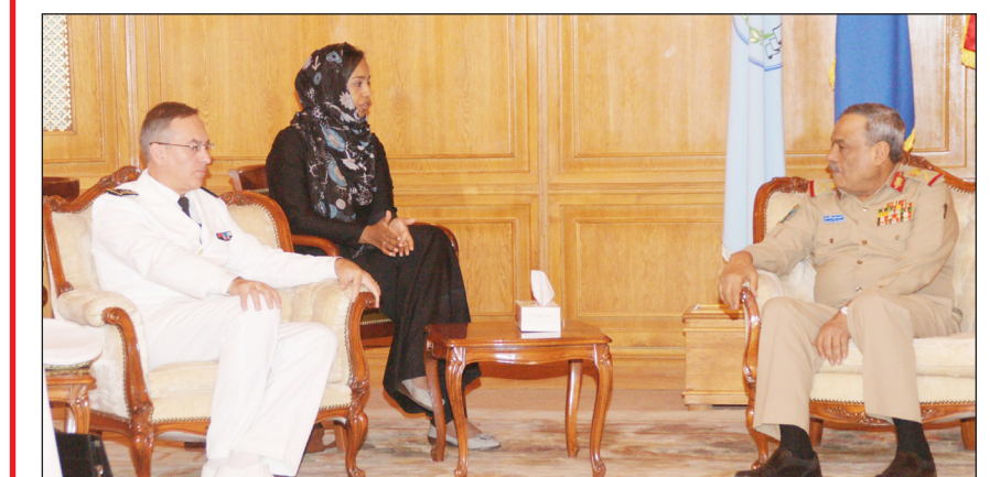
■ الأشول خلال لقائه الوفد العسكري الفرنسي

■ صنعاء / سبأ : التقى رئيس هيئة الأركان العامة اللواء الركن احمد علي الأشول أمس بصنعاء الوفد العسكري الفرنسي الذي يزور بلادنا حاليا برئاسة الأدميرال أنطوان بوسان . وجرى خلال اللقاء بحث عدد من القضايا ذات الاهتمام المشترك ومجالات التعاون الثنائي العسكري القائم بين جيشي البلدين