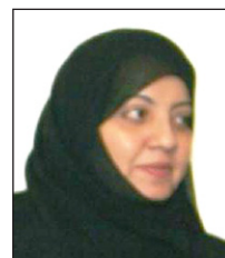
أفراح قائد حماد

الشعوب في المستقبل، وأن علينا أن نتيح كافة الإمكانيات من أجل إيجاد وضع جدير بالأطفال محققين أهداف التنمية الألفية ومراعين مصلحة الطفل الفضلى وحقه في الحياة والنماء والبقاء. وأكدت حماد أن الطفولة ما تزال هي القضية الأولى والأساسية بحكم أن الطفل هو نصف الحاضر وكل المستقبل. ولفتت حماد إلى أن الإعلام يجسد هدفاً سامياً من خلال رفع الوعي المجتمعي بقضايا الطفولة، وأن المجتمع العربي قد شهد في ظل العولمة طفرة إعلامية غير مسبوقة بفضل ثورة المعلومات، وهو أمر يفرض مسؤولية كبيرة على إعلامنا بوسائله المختلفة والمتنوعة، والتي لا شك أنها تلعب دوراً مهماً في التوعية المجتمعية وتعد دعائم أساسية للبنية الفكرية للأسرة.