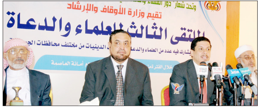
في افتتاح الملتقى الثالث لرجال الدين لدعم مخرجات الحوار

مخاوف الناس أو يقلقهم في هذا الخصوص» وأكد أمين عام مؤتمر الحوار الوطني الشامل في افتتاح الملتقى الثالث لرجال الدين لدعم مخرجات الحوار الوطني الذي بدأ أعماله أمس في صنعاء أنه تم الاتفاق نهائيًا على معظم موضوعات المؤتمر وبقي موضوعان فقط سيتم الاتفاق النهائي