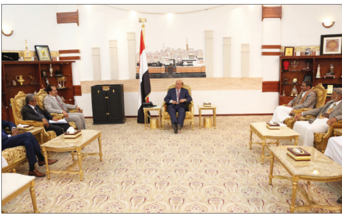
رئيس الجمهورية خلال استقباله لجنة إنهاء التوتر في دماج

وكلف الأخ الرئيس أعضاء اللجنة بمتابعة وحل قضية الحوثيين والسلفيين في منطقة معبر لإنهاء التوتر وإيجاد الحلول الكفيلة بإغلاق هذه القضية وفتح صفحة جديدة للتعايش والتوافق بين كافة الأطراف.