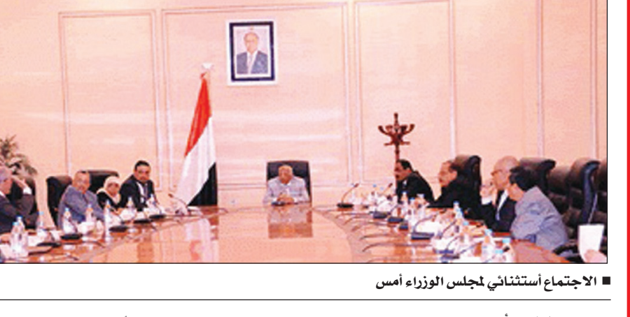
الاجتماع أستثنائي لمجلس الوزراء أمس

صنعاء / سبأ: ناقش مجلس الوزراء في اجتماع استثنائي عقده أمس برئاسة رئيس المجلس الأخ محمد سالم باسندوة، الوضع القانوني للمجالس المحلية القائمة التي انتهت مدة ولايتها القانونية في العشرين من سبتمبر الجاري. واستعرض المجلس بهذا الخصوص المتكررة المقدمة من وزير الشؤون القانونية بشأن الرأي القانوني، بناء على رفع وزير الإدارة المحلية حول انتهاء ولاية المجالس المحلية القائمة، وما توصلت إليه الوزارة من نتائج حول دراستها لهذا الموضوع من كافة جوانبه، بما في ذلك المقترحات القانونية للتعامل معه. ووقف المجلس أمام عدد من المقترحات والأفكار المقدمة من الوزراء بخصوص التعامل الموضوعي والواقعي في هذا