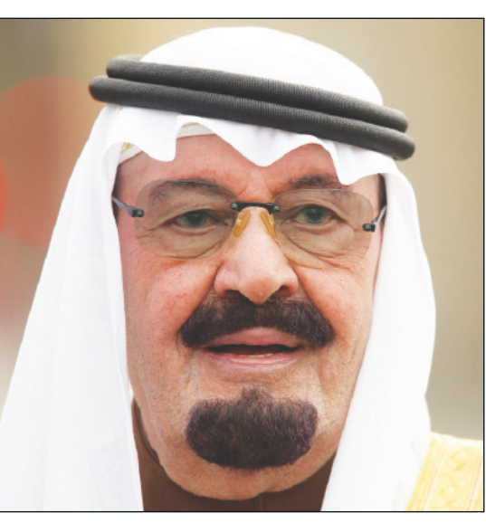
الملك عبد الله بن عبد العزيز

صنعاء / سبأ: بعث الأخ الرئيس عبد ربه منصور هادي رئيس الجمهورية برقية تهنئة إلى خادم الحرمين الشريفين الملك عبد الله بن عبد العزيز آل سعود ملك المملكة العربية السعودية، بمناسبة احتفالات الشعب السعودي الشقيق بالعيد الوطني.