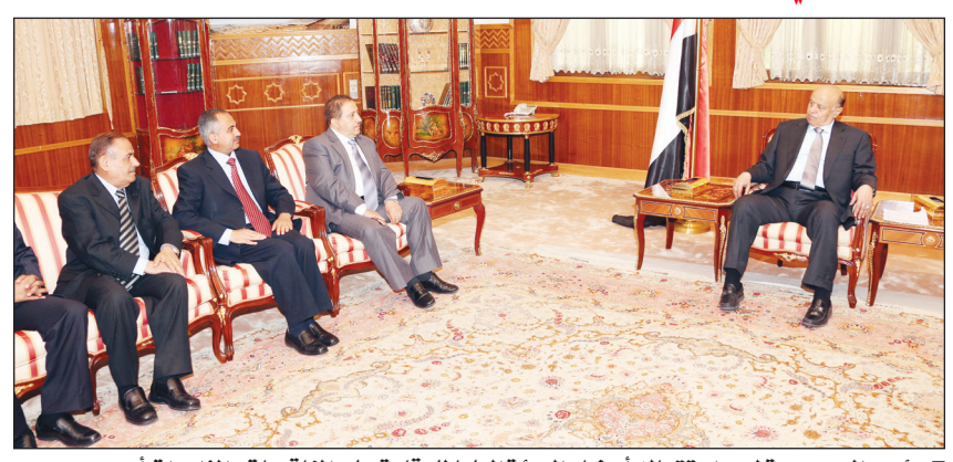
رئيس الجمهورية لدى استقباله أعضاء الهيئة العليا للرقابة على المناقصات والمزايدات أمس