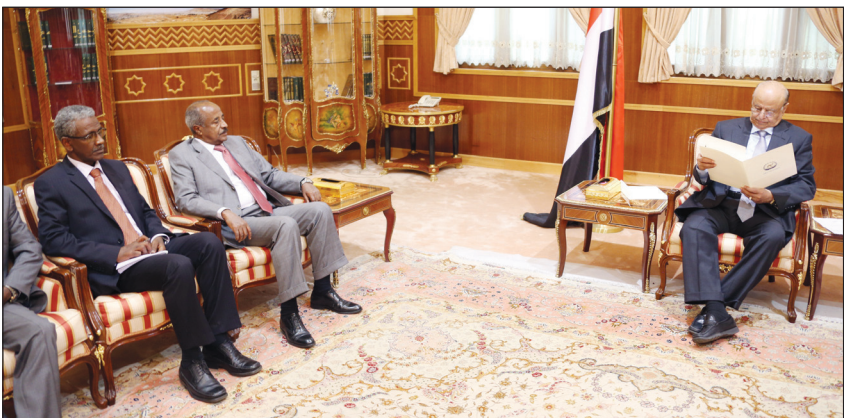
الرئيس لدى استقباله وزير الخارجية الإرتيري أمس

■ صنعاء / سبأ: استقبل الأخ الرئيس عبد ربه منصور هادي رئيس الجمهورية أمس وزير الخارجية الإرتيري عثمان صالح الذي سلم له رسالة من الرئيس الإرتيري أساسيا افورقي تتصل بالعلاقات الثنائية بين البلدين وسبل تعزيزها وتطويرها بما يخدم المصالح المشتركة وفي مختلف المجالات . وفي اللقاء عبر الأخ الرئيس عبد ربه منصور هادي عن سروره بزيارة وزير الخارجية الإرتيري الى اليمن .. مستعرضا العلاقات الثنائية والتاريخية بين البلدين والتي تعود جذورها الى الأزل . وقال « ان ما يربط اليمن بارتيريا والقرن الافريقي ويجعلها أكثر مما يفرقها مما يستدعي العمل المشترك من أجل الحفاظ على أمن وسلامة المنطقة باعتبار الجميع معينين بأمن واستقرار المنطقة لموقعها الجغرافي والملاحي الدولي المهم وما يؤثر على استقرار وأمن أي طرف يتأثر به الطرف الآخر .