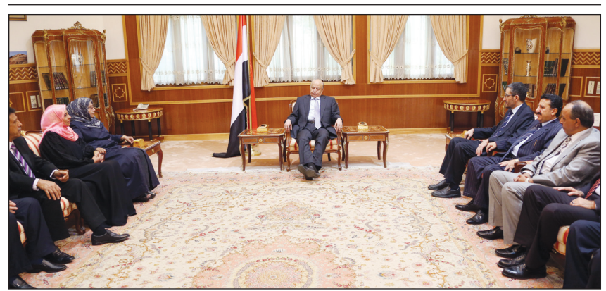
.. ولدى استقباله أعضاء الهيئة الوطنية لمكافحة الفساد أمس

■ صنعاء / سبأ: كعادته في اليمين الدستورية أمام الأخ الرئيس عبد ربه منصور هادي رئيس الجمهورية أمس الإخوة أعضاء الهيئة الوطنية العليا لمكافحة الفساد .