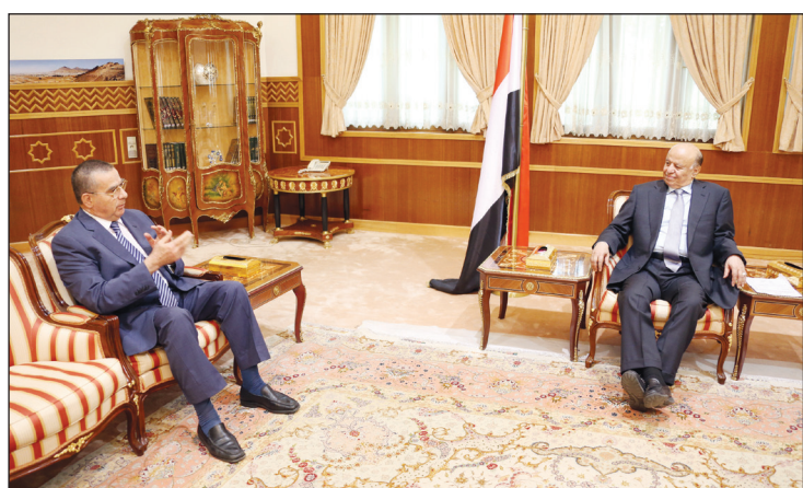
الرئيس لدى استقباله السفير الفلسطيني أمس

■ صنعاء / سبأ: استقبل الأخ رئيس عبد ربه منصور هادي رئيس الجمهورية أمس بمكتبه بدار الرئاسة سفير دولة فلسطين باسم الاغا وذلك بمناسبة انتهاء فترة عمله في اليمن . وفي اللقاء اشاد الأخ الرئيس بالجهود العملية الدبلوماسية التي قام بها الأخ السفير خلال فترة عمله في اليمن . وقال «اليمن وفلسطين دفعتا ثمن الحرب الباردة وكانت نتائج ذلك مجحفة على البلدين الشقيقين .