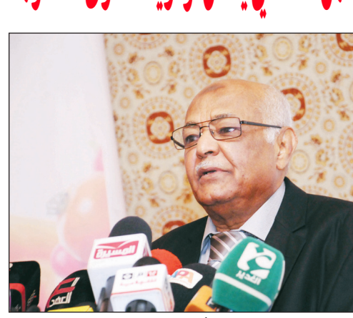
باسندوة يلقي كلمته في الورشة أمس

■ صنعاء / سبأ: أكد رئيس مجلس الوزراء الأخ محمد سالم باسندوة، أن موضوع الأمن الغذائي ما زال يحتل أولوية قصوى للحكومة باعتباره أحد التحديات الرئيسية التي تواجه اليمن .. مشيرا إلى أن تحسين الأمن الغذائي يعتبر عاملا رئيسيا للتخفيف من الفقر وسوء التغذية وسوف يساعد أيضا على رفع النمو الاقتصادي وخلق فرص العمل . وقال الأخ رئيس الوزراء لدى افتتاحه أمس بصنعاء ورشة العمل التشاورية لتخطيط وتفعيل الاستراتيجية الوطنية للأمن الغذائي « إن الحكومة وإيماناً منها بالأبعاد المختلفة للأمن الغذائي، لم يغب عنها طرق موضوع الأمن الغذائي سواء كان في البرنامج العام للحكومة أو البرنامج المرحلي للاستقرار والتنمية وخطط الأداة السنوية للحكومة المقررة من قبل مجلس الوزراء والتأكيد على هذه القضية وضرورة رفع مستوى الأمن الغذائي ومعالجة سوء التغذية وخفض نسبها .