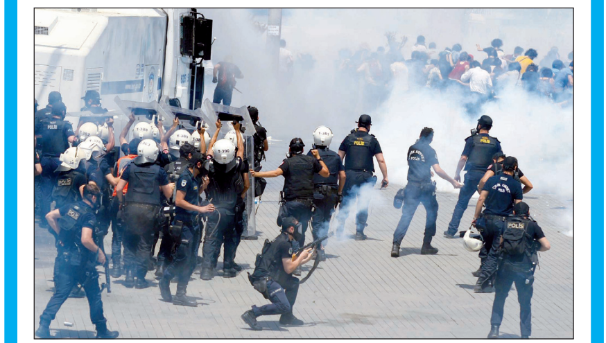
■ الشرطة التركية أثناء تفريق المظاهرة الاحتجاجية