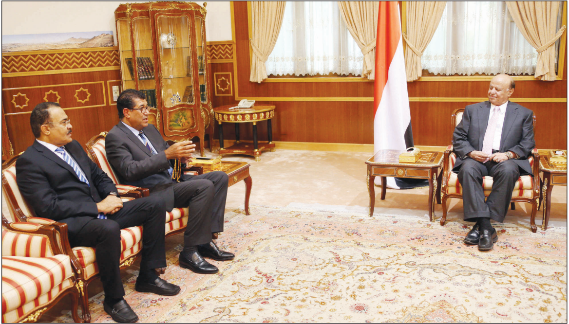
■ رئيس الجمهورية لدى استقباله نائب رئيس مجلس الشورى البحريني أمس

وفي اللقاء عبر نائب رئيس مجلس الشورى البحريني جمال فخر عن تقديره الكبير للأخ الرئيس ونقل الية تحيات جلالته الملك حمد بن عيسى آل خليفة وولي عهده سلمان بن حمد آل خليفة ورئيس الوزراء خليفة بن سلمان آل خليفة .. مؤكداً وقوف اليمن إلى جانب مملكة البحرين وتضامنه معها في كل القضايا التي تمهها .