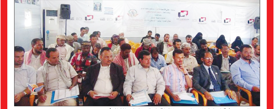
■ جانب من ورشة العمل لسفراء الحوار ومنظمات المجتمع المدني بالضالع أمس

منظمات المجتمع المدني بدورها التوعوي تجاه المجتمع وحشد الدعم لمخرجات الحوار ، وكذا اضطلاع وسائل الإعلام بمسؤولياتها الكبيرة تجاه الوطن من خلال تحري الدقة والمصداقية . ودعوا القطاع الخاص إلى القيام بدوره الداعم لأنشطة ومشاريع الحوار الوطني واقترحوا قيام القطاع الخاص بعمل شعارات وكلمات توعوية في كل منتجاته . ويعد استعراض عمل المجموعات قام المشاركون في الورشة بالإجابة على استمارة استبيان تحليل احتياجات منظمات المجتمع المدني في المحافظة وماهي احتياجاتها كي تؤدي دورها على أكمل وجه . يذكر انه تم تنفيذ خيمة للحوار الوطني بالضالع منذ بداية يوليو الماضي مناقشة كافة القضايا المحلية والوطنية وستستمر حتى نهاية الحوار الوطني .