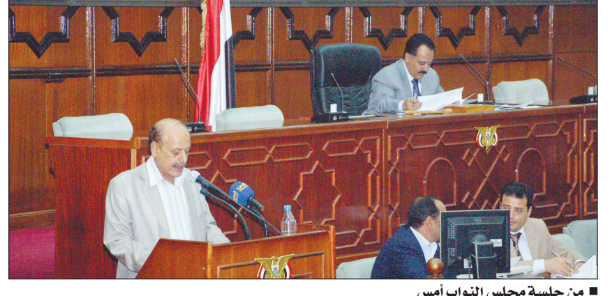
■ من جلسة مجلس النواب أمس

والذي بموجبها وافق الصندوق على منح اليمن هذا القرض وموافقة المجلس بتقارير ربع سنوية عن مستوى الإنجاز في تنفيذ البرنامج . وأكد المجلس في توصياته للحكومة ضرورة اتخاذ الإجراءات اللازمة لتخفيف عجز الموازنة ووضعها في مستويات قابلة للاستدامة والعمل على تغطيته من مصادر غير تضخمية عبر تنمية الموارد غير النفطية والتحصيل المستحق للدولة بموجب أحكام القوانين والأنظمة النافذة والزم المجلس الحكومة موافاته بتقارير ربع سنوية عن المبالغ المسحوبة من القرض ومجالات إنفاقه . من جهة أخرى أقر المجلس التقرير التكميلي للجنة التجارة والصناعة بشأن