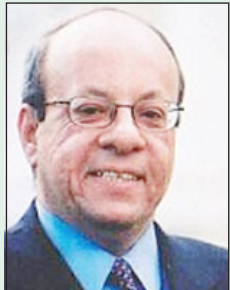
وحيد عبد المجيد

كما وافقت حركة النهضة على تعديل الحكومة الجاري، وتخلت عن وزارات كان استحوذها عليها مستفزاً للمعارضة، وهكذا يختلف الوضع في تونس عما كان عليه في مصر، ولكن ليس إلى المدى الذي يجعل قيادة حركة النهضة مطمئنة. فلم يحل الائتلاف الثلاثي دون هيمنة هذه الحركة على كثير من مفاصل الدولة واستحوذها على القرار النهائي في ظل مقاومة محدودة من شريكها اللذين خسرا الكثير من رصيدها الشعبي لصالح قوى ليبرالية ويسارية أخرى. تطالب ببناء شراكة وطنية حقيقية. ولكن الأهم من دور هذه القوى هو غضب قطاعات متزايدة من الشباب وإقتداء بعضهم بما حدث في مصر وإعلانهم تأسيس حركة ترمز التي قال مؤسسها محمد بن نور إن شباب تونس يسير على خطى الشباب المصري.