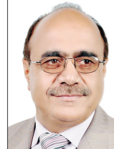
علي محمد راجح

تعزيز علاقات التعاون الثنائي في المجال الإعلامي. وزير الإعلام على العمراني على رأس وفد اليمن في زيارة تستغرق أسبوعاً يجري خلالها مباحثات مع المسؤولين في الحكومة الصينية لتناول