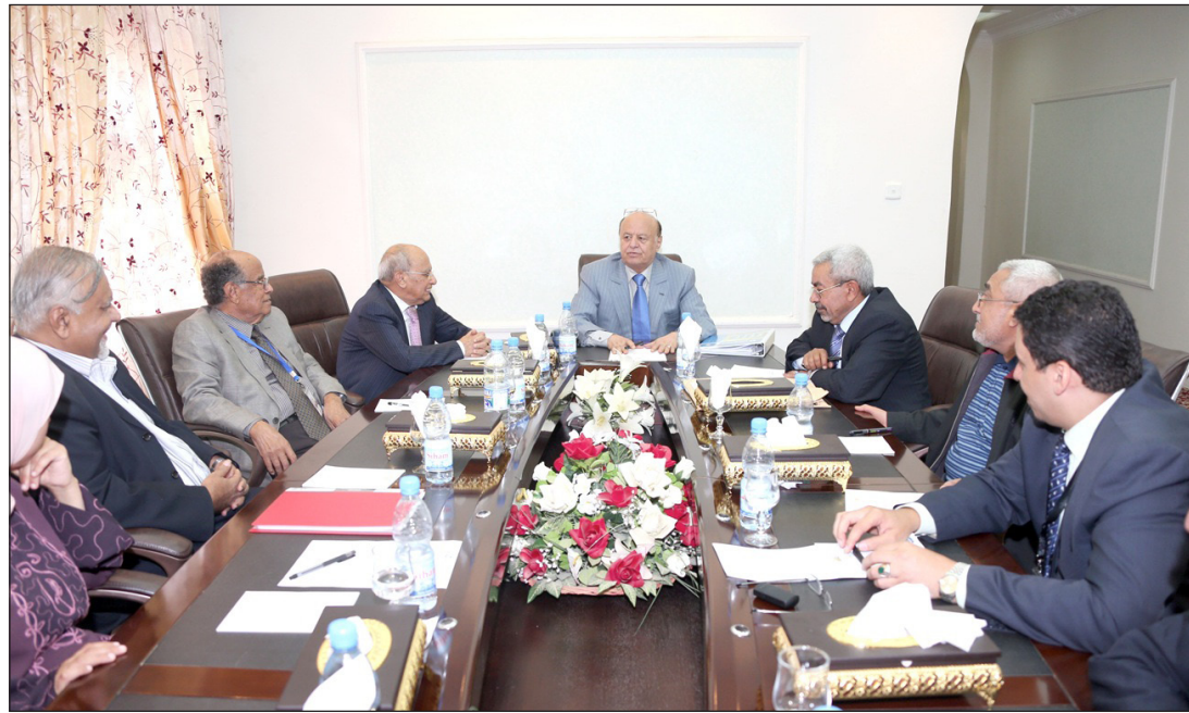
رئيس الجمهورية يتراس اجتماع هيئة رئاسة مؤتمر الحوار

الأمكان أو الأراضي المؤجرة واستعداداته. وناقش الاجتماع ما تم التوصل إليه فيما يتعلق بعودة المبعدين من الموظفين المدنيين والعسكريين الذين أحيلوا قسراً إلى التقاعد أو الإبعاد كما جرى مناقشة رسالة الاعتذار التي ستقدم من الحكومة حول القضية الجنوبية وقضية صعدة وتم الاتفاق على استكمال المناقشات حتى الوصول إلى الاتفاق النهائي.