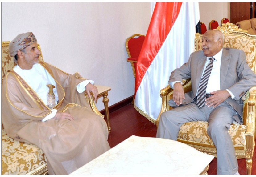
باسندوة خلال استقباله سفير سلطنة عمان

وجرى خلال اللقاء تناول العلاقات الثنائية بين البلدين والشعبين الشقيقين الجارين وما تشهده من تطور مستمر في مختلف الميادين السياسية والاقتصادية والاجتماعية والثقافية وغيرها.