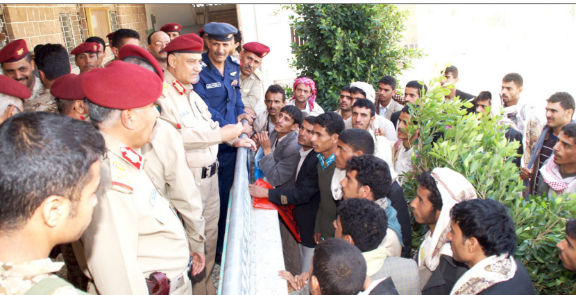
وزير الدفاع خلال تفقده مراكز التسجيل للكلية العسكرية

وشدد على ضرورة الجدية والدقة والحرص على استيفاء كافة شروط القبول وفقاً لخطة وإجراءات القبول المحددة.. مشيراً إلى أن الآلية الجديدة للقبول لهذا العام جاءت من منطلق الحرص على إتاحة الفرصة أمام خريجي الثانوية العامة من كافة المحافظات وتسهيل إجراءات القبول ومراعاة ظروف وإمكانيات الطلاب بما يحقق العدالة والمساواة وتكافؤ الفرص بين المتقدمين في كافة المحافظات وفقاً لعدد السكان.