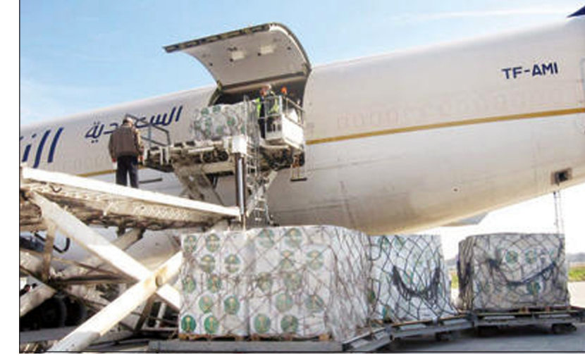
جانب من المساعدات السعودية للقاهرة

العنف التي تلت ثورة 30 يونيو وعزل الدكتور محمد مرسي. جدير بالذكر أن الملك عبدالله وجه خطاباً للحرب والعالم الجمعة الماضية، اعتبره محللون تاريخياً، دماً فيه الفرقاء في مصر إلى حل الأزمة، مؤكداً أن ما يحدث في مصر هو محاولة لتقسيمها وقصم ظهر المجتمع العربي من خلال ذلك.