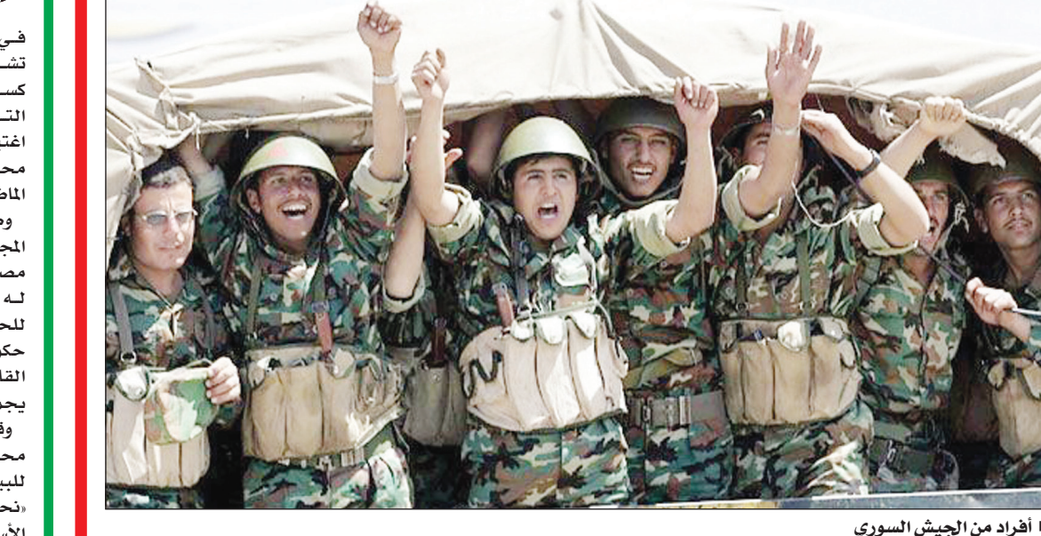
أفراد من الجيش السوري

صنعاء / متابعات: من جهة أخرى قالت الأنباء إن قوات الحماية الكردية طردت المسلحين من قرية قرزة علي، في ريف تل أبيض وتسيطر عليها بشكل كامل وقد قتل أفراد مجموعة مسلحة بينهم متزعم مجموعة ما يسمى «لواء البراء» ودمر مقر لمجموعة تنتمي للنصرة في مزارع الشيفونية بدوما. وفي حرسنا شرق شركة دايا وقرب تجمع المدارس أسفرت الاشتباكات بين الجيش السوري والجماعات الإرهابية المسلحة عن مقتل عدد من المسلحين وقد تم تدمير أسلحتهم.