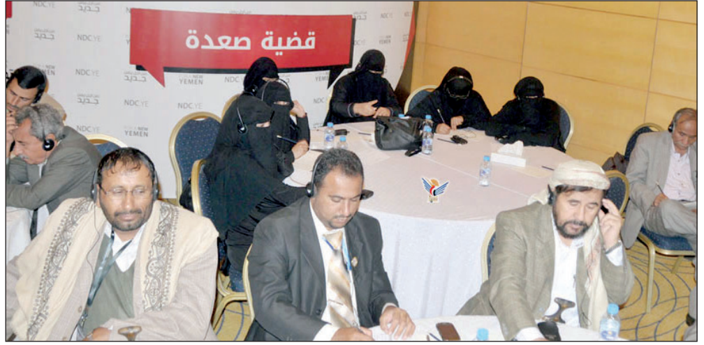
فريق قضية صعدة في مؤتمر الحوار الوطني

الفعالية في كل مؤسسات الدولة عبر الالتزام بالديمقراطية والتعددية السياسية الحزبية والتداول السلمي للسلطة من خلال انتخابات حرة ونزيهة وشفافة. وحضى القرار الثالث باطلاق برنامج مزمن لدعم معيشة السكان والمناطق المتضررة من النزاع لتحسين ظروفهم الاقتصادية واعتماد برامج لدعم المشاريع الصغيرة والمتوسطة في تلك المناطق وبالأخص المتضررة من الحرب وبحسب الحاجة والحرمان. وبالتوافق على هذه القرارات يصبح إجمالي القرارات التي استخلصتها لجنة الحلول والضمانات بفريق عمل قضية صعدة ثلاثين قراراً.