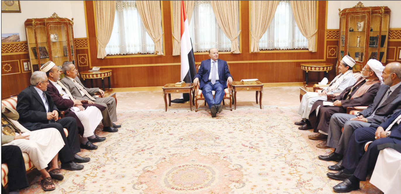
رئيس الجمهورية لدى استقباله أعضاء المؤتمر العام الثالث للمنتدى القضائي أمس

صنعاء / سبأ: استقبل الأخ الرئيس عبد ربه منصور هادي رئيس الجمهورية أمس بمكتبه بدار الرئاسة، القضاة أعضاء المؤتمر العام الثالث للمنتدى القضائي الذي ستدشن أعماله اليوم الثلاثاء في العاصمة صنعاء وذلك في إطار أعمال المنتدى الدورية وكذلك البحث فيما بهم المنتدى والقضاة من مختلف الجوانب. وقد أكد الأخ الرئيس على أهمية تناسق وتكامل الأداء بين السلطات .. مشيراً إلى أن السلطة القضائية تعتبر من أهم مكونات الدولة والعدالة إلى اعتبار العدل أساس الحكم. ونوه إلى أن العمل القضائي يجب أن يكون بعيداً عن الولاءات الحزبية والمناطقية والجهوية ليكون نموذجاً يقتدى به في المجتمع وفي سلطات الدولة والحكومة .. مؤكداً أن ما يجري من تناقضات أو تداعيات هنا وهناك يجب أن لا تنعكس على القضاء بل يجب أن تكون حافزاً مهما لحشد الطاقات والامكانيات من أجل العمل على تلافى تلك التناقضات وتغليب مصلحة الوطن العليا على ما عداها من المصالح الضيقة والائتمانية.