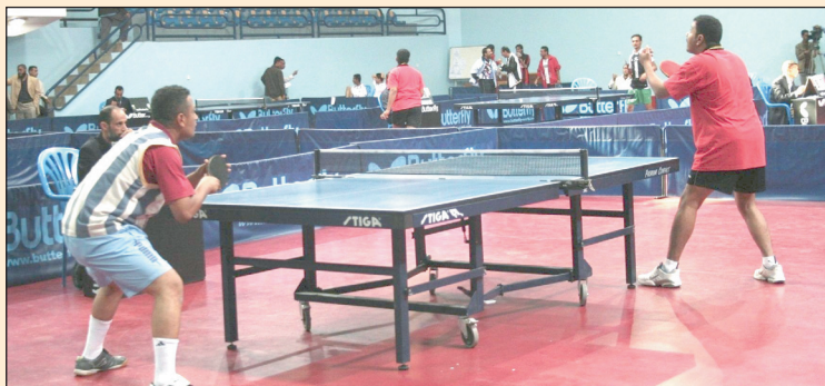
العرب في البطولة الدولية التي ستقام بمدينة أربيل العراقية قبل أن يغادر إلى قطر للمشاركة في نهائيات آسيا للناشئين التي ستقام خلال الفترة من ٢٠ أغسطس حتى ٤ سبتمبر القادم.