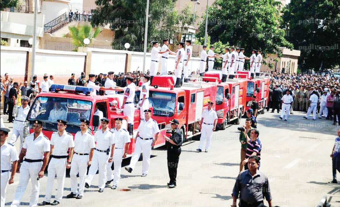
أثناء تشييع جناحين عدد من شهداء الشرطة أمس

وزير الداخلية واللواء أركان حرب توحيد توفيق قائد المنطقة المركزية العسكرية، الذي قدم وعدد من قيادات الجيش وأجابه شهداء الشرطة، وحلقت بكثافة الطائفة المروحية للشرطة لتمشيط المنطقة وعمل مسح كامل خوفاً من تعالت إرهابية . وفي مشهد مهيب تعالت فيه صرخات آباء وأمها شهداء الشرطة الذين أصيبوا بحالة من البكاء الهستيري والانهايار حزناً على فراق أبنائهم، وفي لحظة إنسانية بكى لها مشيعو الجنازة أطلقت أمهات الشهداء