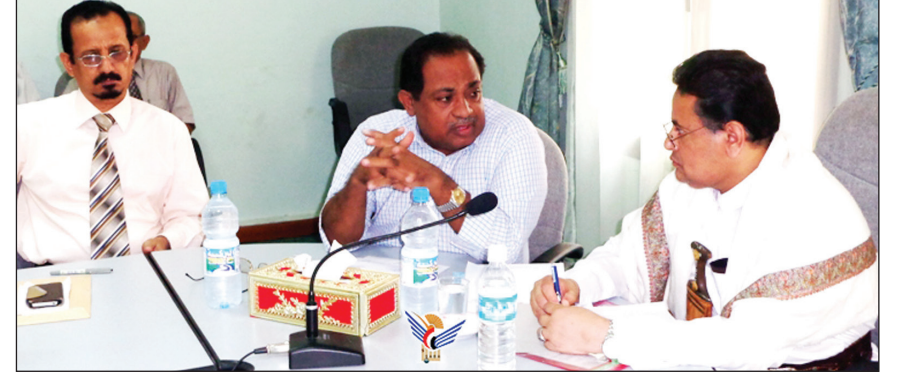
وزير المالية لدى اجتماعه بإدارة المؤسسة المحلية للمياه والصرف الصحي بالحديدة أمس

الحديدة / سيا : طالب وزير المالية صخر الوجيه قيادتي السلطة المحلية والمؤسسة المحلية للمياه والصرف الصحي بسرعة إعداد الدراسات الخاصة بمشروع الإحلال لشبكة الصرف الصحي بالمحافظة وإعلان مناقصة المشروع الذي خصص له أكثر من عشرة ملايين دولار . وأكد على ضرورة البحث عن شركة استشارية متخصصة وذات خبرة عالية لإعداد الدراسات الخاصة بالشبكة الجديدة للمحافظة والذي اعتمد له مبلغ ثلاثة مليارات ريال لعدد 14 مناقصة لتسراء وتوريد وتركيب معدات المياه والصرف الصحي . جاء ذلك خلال اجتماعه مع مجلس إدارة المؤسسة المحلية للمياه والصرف الصحي بالمحافظة بحضور