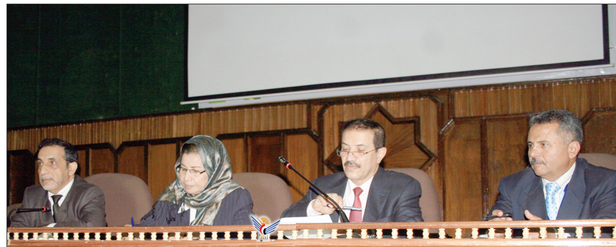
جانب من المؤتمر الأكاديمي لدعم مؤتمر الحوار الوطني أمس

وفي سبيل أولوية الحسم النهائي لهذه القضية ضرورة الإقرار بمظلومية الجنوب، وإدانة كافة الأعمال والممارسات والانتهاكات التي أدت إلى هذه المظلومية، وطالت الحقوق العامة والخاصة للأفراد، والتعامل معها باعتبارها قضايا لا تسقط بالتقادم . وشددوا على أهمية إنهاء كافة الأسباب التي أدت إلى نشوء هذه القضية بأبعادها الشاملة السياسية والاقتصادية والاجتماعية والثقافية، وفق صيغة حل شاملة وعادلة، تستوعب النقاط الـ 20، والنقاط لوضع الحلول العملية لمعالجة مختلف المشاكل المطروحة على طاولة الحوار . وبحسب البيان الختامي للمؤتمر الأكاديمي، أكد المؤتمرين فيما يتعلق بالقضية الجنوبية