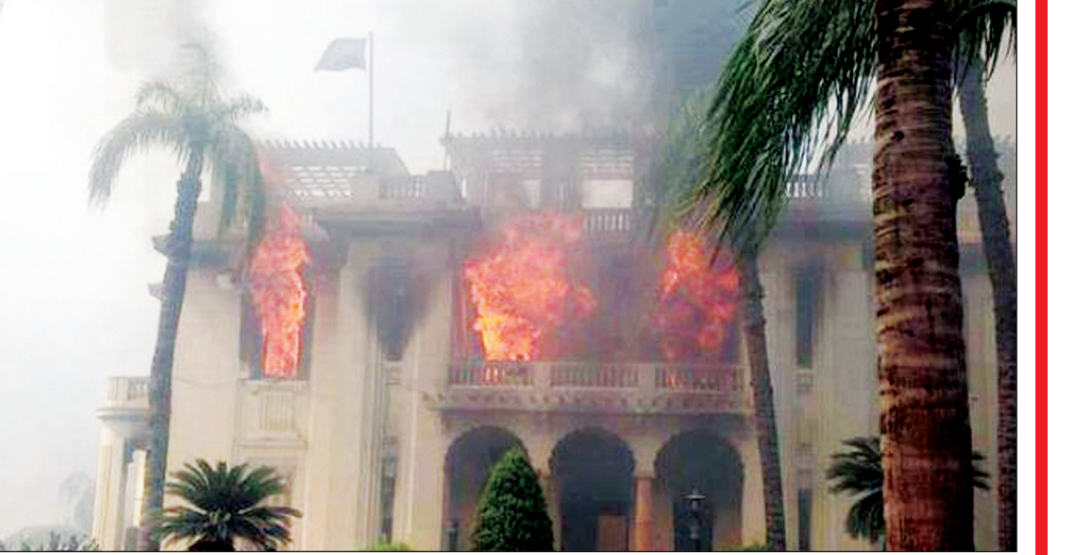
مبنى محافظة الجيزة وهو يحترق أمس

ونجح رجال الإدارة العامة للحماية المدنية بالجيزة في إنقاذ نحو 7 أشخاص من العالقين بمبنى محافظة الجيزة عبر السلام الهيدروليكية في الوقت الذي وصل فيه عدد سيارات الإطفاء التي تحاول السيطرة على النيران إلى نحو 12 سيارة . وكان العشرات من أنصار الرئيس المعزول هاجموا مبنى محافظة الجيزة بشوارع الهرم، وأشعلوا النيران في الطابق العلوي من المبنى باستخدام زجاجات المولوتوف، ثم فروا هاربين وأسفر الحريق عن عشرات المصابين . وقال مصدر مسؤول بمديرية أمن الجيزة، إن أجهزة الأمن تمكن من ضبط عدد من المتهمين من خلال الأكمة الأمنية المتواجدة بمنطقة الهرم . وانتقلت النيابة إلى مبنى المحافظة، لمعاينة موقع الحادث .