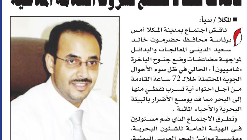
خالد سعيد الديني

ناقش اجتماع بمدينة المكلا أمس برئاسة محافظ حضر موت خالد سعيد الديني العالجات والبدايل لمواجهة مضاعفات وضع جنوح الباخرة «شامبيون 1»، الحالي في ظل سوء الأحوال الجوية المحتملة خلال 72 ساعة القادمة من أجل احتواء أية تسرب نفطي منها إلى البحر مما قد يوسع الأضرار بالبيئة البحرية والأحياء المائية .