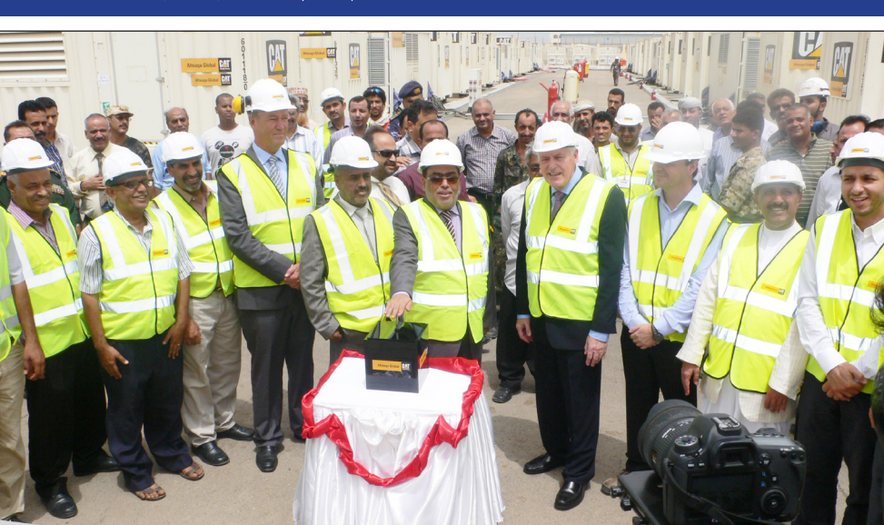
محافظة عدن خلال تدشين محطة توليد الكهرباء بقوة 54 ميغاوات