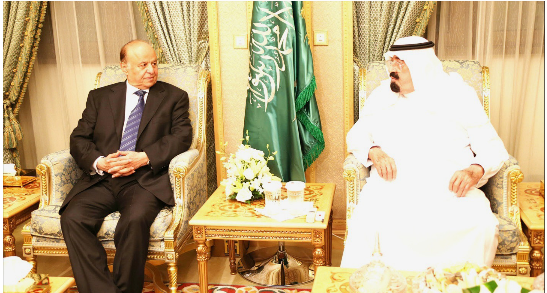
رئيس الجمهورية والملك عبدالله بن عبدالعزيز خلال جلسة المباحثات

وقال: «نحن اليوم ماضون في الحوار الوطني الذي يمثل جسر العبور باليمن من مرحلة الصراعات