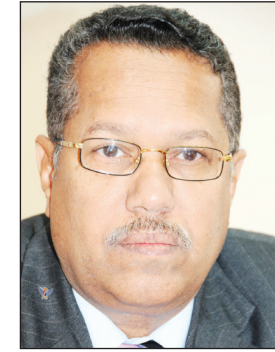
د. أحمد عبيد بن دغر

■ صنعاء / بشير الحزمي: أوضح الدكتور أحمد عبيد بن دغر وزير الاتصالات وتقنية المعلومات الأمين العام لمؤتمر الحوار الوطني أنه لم ينشئ أي صفحات خاصة به على ال(فيس بوك) مواقع التواصل الاجتماعي، وأن لا علاقة له بصفحة تحمل اسمه أو صفته في تلك المواقع، ولا بمضامين ما تحتويه تلك الصفحات على لسانه من كتابات أو أخبار غير صحيحة. وذكر بيان توضيحي صدر عن الإدارة العامة للعلاقات والإعلام بوزارة