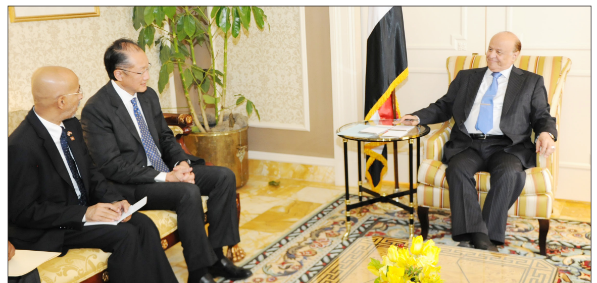
رئيس الجمهورية يستقبل رئيس مجموعة البنك الدولي

■ واشنطن / سبأ: استقبل الأخ الرئيس عبدربه منصور هادي رئيس الجمهورية في مقر إقامته بالعاصمة الأمريكية واشنطن مساء الأربعاء رئيس مجموعة البنك الدولي الدكتور جيم يونج كيم. وجرى خلال اللقاء استعراض مجالات التعاون القائمة بين بلادنا والبنك ووافق