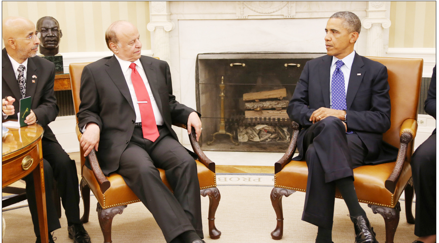
رئيس الجمهورية خلال محادثات القمة مع الرئيس الأمريكي

■ واشنطن / سبأ: حضر الأخ الرئيس عبدربه منصور هادي رئيس الجمهورية لقاءً عقد مساء الأربعاء في قاعة لجنة العلاقات الخارجية في الكونغرس الأمريكي بواشنطن و ضم رئيس لجنة العلاقات الخارجية في مجلس الشيوخ السيناتور روبرت ماينديز وعددًا من أعضاء لجنتي العلاقات الخارجية والخدمات العسكرية من بينهم القيادي في الحزب الجمهوري السيناتور جون ماكين الذين رحبوا بزيارة الأخ الرئيس لواشنطن ترحيباً حاراً. وأشاروا إلى أنهم يتطلعون إلى أخبار اليمن