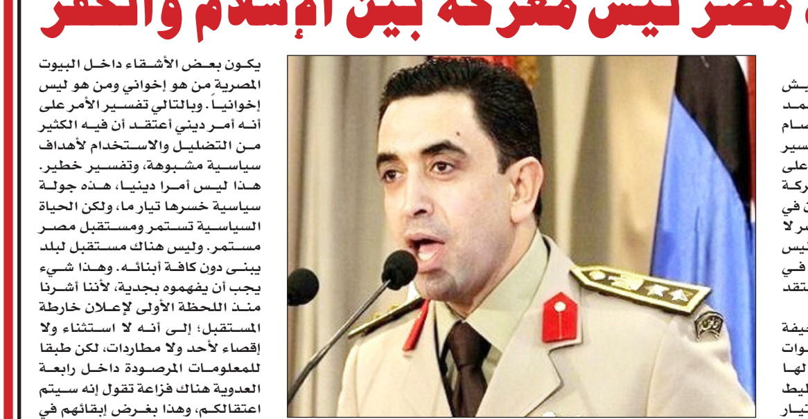
العقيد أحمد محمد علي

■ القاهرة / متابعات: أكد المتحدث باسم الجيش المصري العقيد أحمد محمد علي أن الخطير في اعتماد رابعة العديوية هو محاولة تصفير البعض لما تشهده مصر حالياً على منصة "رابعة" بأن هناك معركة حتمية بين الإسلام والكفر، وكان في مصر لا يرفع أذان، وكان في مصر لا يصوم المصريون بعد ذهاب الرئيس المعزول، وكان الإسلام ينتهي في مصر، ولأسف بعض الناس تعتقد هذا الأمر. وأشار علي خلال حديثه لصحيفة "الشرق الأوسط" إلى أن القوات المسلحة والأجهزة الأمنية لها أسلوبها في العمل وفي التخطيط وفي الإعداد والتجهيز واختيار التوقيت المناسب وتهديد الظروف وإيجاد الظروف المناسبة لتنفيذ أي عمل، متمنياً أن يدرك المعتصمون أنهم ليسوا في مواجهة مع جيشهم، وأن يتفهموا أن هناك واقعا جديداً مصريون، منهم جاري ومنهم وأضاف: "الإخوان أو أشقاؤنا زميلي في الفصل الدراسي، وقد