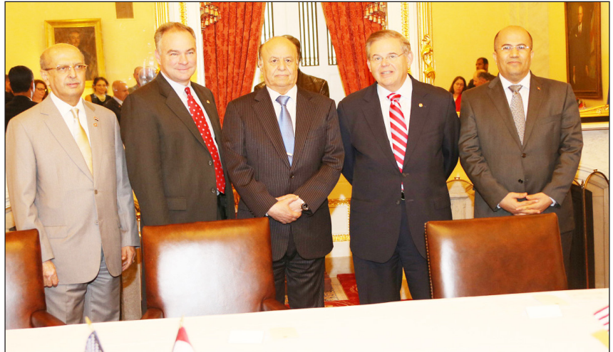
الرئيس يستقبل رئيس لجنة العلاقات وأعضاء في مجلس الشيوخ الأمريكي

التقى رئيس لجنة العلاقات وعددًا من أعضاء مجلس الشيوخ الأمريكي الرئيس يشدد على ضرورة خروج اليمن بنجاح من المرحلة الانتقالية