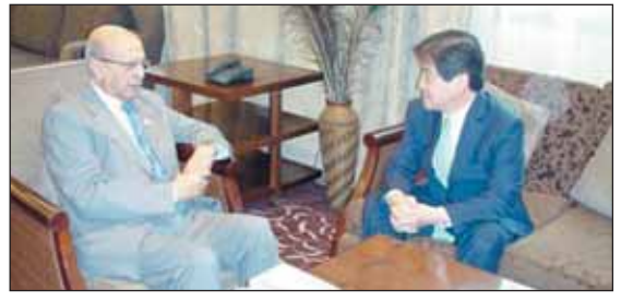
صنعاء / سبأ

تسلم وزير الخارجية الدكتور ابوبكر القزبي أمس نسخة من أوراق اعتماد السفير / يونج هولي كسفير مفوض وفوق العادة لجمهورية كوريا لدى اليمن .