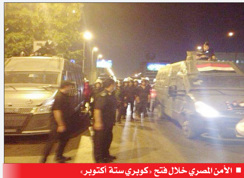
الأمن المصري يفتح خلال فتح «كوبري ستة أكتوبر»

القاهرة/ متابعات: قال اللواء أسامة الصغير مساعد أول وزير الداخلية المصري لأمن القاهرة إن قوات الأمن أعادت فتح كوبري أكتوبر في الاتجاهين، بعد أن قام أنصار الرئيس المعزول محمد مرسي بقطع أعلى منطقة رمسيس وذلك بعد أن أطلقت القوات قنابل الغاز وقامت بتفريقهم. وأضاف «الصغير» في تصريحات صحفية أن «أجهزة الأمن حاولت بكل الطرق توجيه النصح إلى المتظاهرين وطلبت منهم عدم قطع الطرق وتعطيل المرور إلا أنهم تمادوا وقاموا ببناء جدار أسمنتي أعلى كوبري أكتوبر مما دفع القوات إلى التعامل مع المتظاهرين وتفريقهم والاستعانة بعدد من (اللواتر)، لرفع الجدران (الأسمنتي، وإعادة تسخير المرور أمام المواطنين، ومستقل السيارات». وتابع: «أجهزة الأمن أقلت القبض على العشرات ممن قطعوا الطريق ويجري الآن حصر أعدادهم عن طريق عدد من أقسام القاهرة، وسيتم فحص مدى علاقتهم بالاعتصام وقطعهم للطريق»، معتبراً أن «أجهزة الأمن تحترم الرئيس المعزول في الشوارع الجانبية لميدان رمسيس». وكان المئات من أنصار الرئيس المعزول محمد مرسي قد قطعوا كوبري أكتوبر، أمام ميدان رمسيس، في إطار الدعوات التي أطلقتها جماعة الإخوان المسلمين لسيرت تطالب بعودة الرئيس المعزول محمد مرسي، في مليونية أطلقت عليها «مليونية الصمود». وتجمع المئات المتظاهرين المؤيدين للرئيس المعزول محمد مرسي، على ميدان الشوارع الجانبية لميدان رمسيس. وكان المئات من أنصار الرئيس المعزول محمد مرسي قد قطعوا كوبري أكتوبر، أمام ميدان رمسيس، في إطار الدعوات التي أطلقتها جماعة الإخوان المسلمين لسيرت تطالب بعودة الرئيس المعزول محمد مرسي، في مليونية أطلقت عليها «مليونية الصمود». وتمكنت