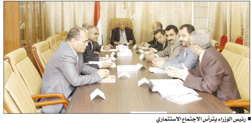
رئيس الوزراء يترأس الاجتماع الاستثماري

صنعا / سبأ: رأس الاخ محمد سالم باسندوة رئيس مجلس الوزراء امس اجتماعاً كرس لمناقشة الجوانب المتصلة بتوجهات الاستراتيجية الوطنية لاستغلال الغاز الطبيعي في مشاريع استثمارية، وذلك في اتجاه النهوض بالقطاعات التنموية الرئيسية خاصة الكهرباء والمياه والزراعة والتنمية المحلية. واطلع الاجتماع الذي ضم وزراء المالية والتخطيط والتعاون الدولي والصناعة والتجارة والشؤون القانونية والمياه والبيئة والنظف والمعادن وامين عام مجلس الوزراء ومدير مكتب رئيس الوزراء، ورئيسي الهيئة العامة للأراضي والمساحة والتخطيط العمراني والهيئة العامة للاستثمار، اطلع على عدد من العروض الاستثمارية المقدمة من قبل شركات استثمارية لتنفيذ مشاريع ذات طابع خدمي تعتمد على الغاز الطبيعي. وقرر الاجتماع في ضوء المناقشات حالة العروض الى اللجنة الوزارية