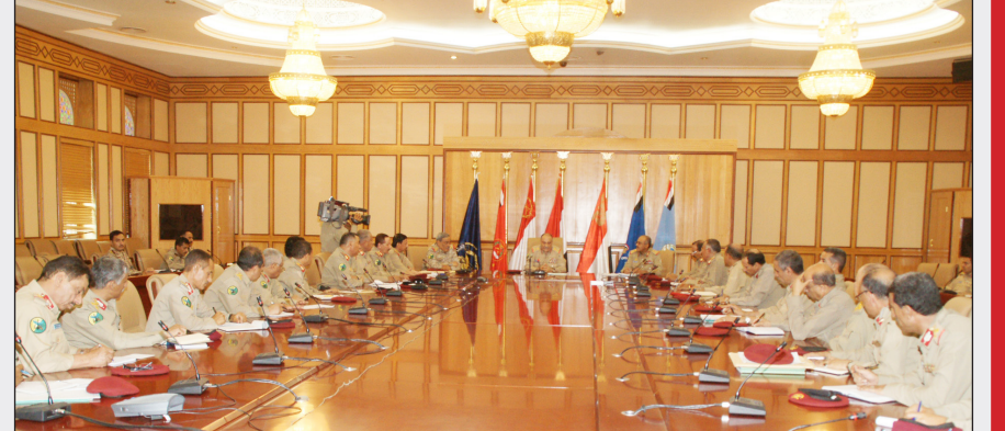
وزير الدفاع خلال ترؤسه الاجتماع المخصص لمناقشة نتائج اللقاء الموسع لقادة القوات المسلحة

عقد بوزارة الدفاع أمس اجتماع موسع برئاسة وزير الدفاع اللواء الركن محمد ناصر أحمد ومعه رئيس هيئة الأركان العامة اللواء الركن أحمد علي الأشول وضم نائب رئيس هيئة الأركان العامة ومساعد وزير الدفاع ورؤساء الهيئات ومدراء الدوائر العسكرية المختصة في وزارة الدفاع . وفي الاجتماع المكرس للوقوف أمام نتائج اللقاء الموسع لقادة القوات المسلحة ووضع التصورات والخطط الكفيلة بتنفيذها لتنعكس في الواقع المعاش للقوات المسلحة ، ألقى