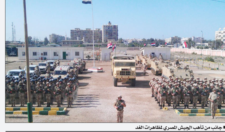
جانب من تأهب الجيش المصري لمظاهرات الغد

قالت مصادر عسكرية مصرية إن طائرات المراقبة الجوية، التي تحلق في سماء القاهرة والمحافظات أحدات التظاهرات أو المليونيات التي تنظمها القوى السياسية المختلفة من أجل السيطرة على أي موقف طارئ أو أي أعمال عنف . وأوضح المصدر ان القوات الجوية بقيادة الفريق يونس المصري وضعت خطة محكمة للتحرك في مختلف الاتجاهات عن طريق التصوير الدقيق لكل ما يجري على الأرض خلال الأحداث التي تشهدها البلاد، حتى لا تتكرر سيناريوهات يوم 28 يناير 2011، التي نتج خلالها إقحام السجون واقسام الشرطة والعديد من المنشآت الحيوية . وأشار المصدر في تصريحات لصحيفة (اليوم السابع) المصرية إلى أن طائرات المراقبة الجوية، تراقب الموقف الأمني بين الحين والآخر على المنشآت الحيوية المهمة، التي قد تتعرض للاحتجاج، أو الاستهداف خلال الأيام المقبلة، مؤكداً أنه حال تعرض تلك المنشآت إلى أي أعمال عنف، سوف يتم إسقاط اطقم من القوات الخاصة جوا لمواجهة أي عمل عداوني عليها . وقال المصدر إن القوات المسلحة على مستوى مختلف الأفرع الرئيسية والتشكيلات التعبوية البرية، وصلت إلى الحالة القصوى من الاستعداد للتحرك في إطار خطة القيادة العامة للقوات المسلحة لحماية المواطنين والأهداف الحيوية الهامة خلال تظاهرات يوم 30 يونيو . وأوضح المصدر ان القوات تتمركز خلال الوقت الراهن في أماكن قريبة جدا من الأحداث والمواقع الحيوية، حيث تتركز عند نقاط تمركز، لتتمكن من التحرك والانتشار السريع لأي منشة حيوية أو لواجهة أي أعمال عنف، تقع في نطاق المكان المكلفة بتأمينه وحمايته، مؤكداً أن خطة التحرك في 30 يونيو اختلفت كثيرا عن خطة 25 يناير .