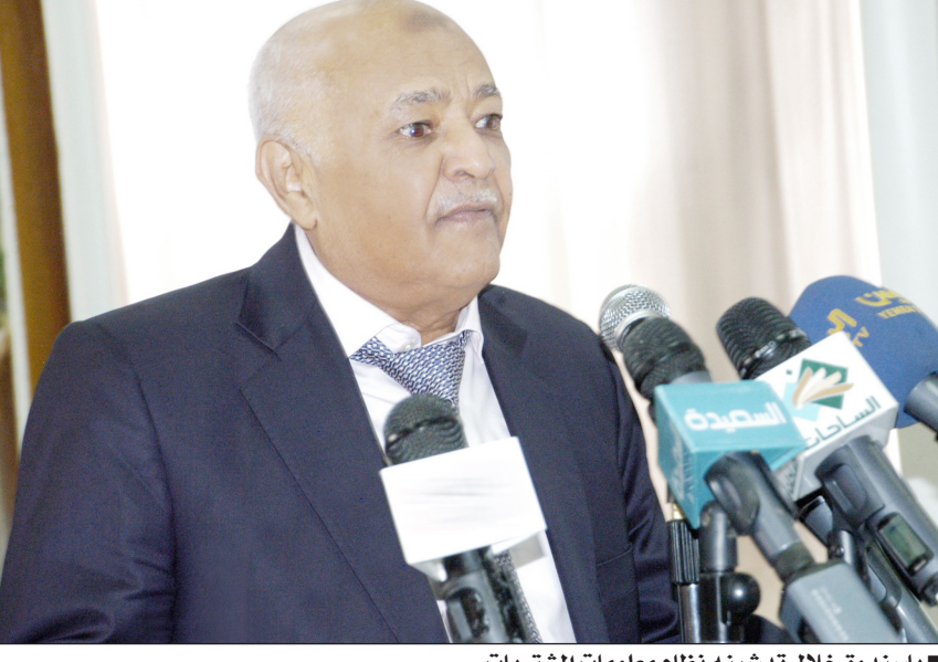
باسندوة خلال تدينيه نظام معلومات المشتريات

دشن رئيس مجلس الوزراء محمد سالم باسندوة أمس بالعاصمة صنعاء مشروع نظام معلومات المشتريات الحكومية (مرحلة القبول التشغيلي) والذي تنفذه الهيئة العليا للرقابة على المناقصات والمزايدات . وفي حفل التدشين الذي حضره عدد من الوزراء وقيادات المؤسسات الرقابية والمعنية والخبراء أكد رئيس الوزراء محمد سالم باسندوة ان الأخذ بهذا النظام يمثل خطوة مهمة على طريق توفير المعلومات الضرورية عن مشتريات الحكومة بسهولة، أولا بأول . وقال ان تدشين النظام إنجاز يستحق عليه رئيس وأعضاء الهيئة العليا