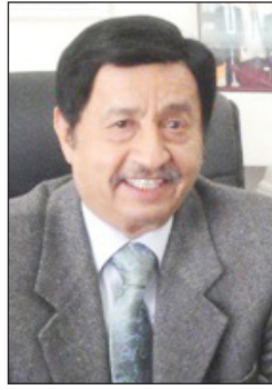
د. عبد الحافظ نعمان

تبدأ اليوم بعموم محافظات الجمهورية الامتحانات النظرية النهائية للمعاهد الفنية والمهنية لجميع المستويات، والمتقدم لها نحو 10 آلاف و 916 طالباً وطالبة، يتوزعون على 27 مركزاً امتحانياً في مختلف المحافظات. وأوضح وزير التعليم الفني والمهني الدكتور عبد الحافظ نعمان أن الوزارة استكملت كافة التجهيزات الخاصة بالاختبارات النظرية النهائية في جميع التخصصات التقنية والمهنية والبالغة 83 تخصصاً منها 41 تخصصاً في نظام دبلوم تقني، و 23 تخصصاً ثانوية مهنية، و 16 تخصصاً دبلوم مهني، و 3 تخصصات مستوى مهني وماهر وفي جميع المستويات. وأشار الوزير نعمان إلى أن الوزارة لأول مرة قامت بنشر جداول الاختبارات وأسماء المراكز الاختبارية وأسماء الطلاب المستعدين والمقبولين للتقدم للاختبارات النهائية عبر موقعها الإلكتروني على الانترنت (www.mtev.info) لتسهيل المهام للجان الامتحانية والطلاب للإطلاع عليها قبل موعد الامتحانات.