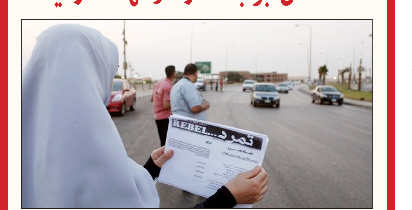
جانب من حملة تمرد

صنعاء / سبأ: أقر مجلس الوزراء في اجتماعه الأسبوعي امس برئاسة رئيس المجلس الأخ محمد سالم باسندوة، السياسة الوطنية لمعالجة النزوح الداخلي في الجمهورية اليمنية، والتي توفر اطارا وطنيا لمعالجة وحل النزوح في اليمن وتحديد الاهداف الحائية واولويات الاستجابة الفعالة للنزوح. وتعالج هذه السياسة قضايا النزوح الداخلي في شتى مراحله من خلال ثلاثة اهداف متداخلة هي: حماية المدنيين من النزوح غير الطوعي والاستعداد لاي نزوح محتمل، وحماية ودعم ومساعدة النازحين اثناء النزوح ودعم المجتمعات المتضررة من النزوح، اضافة الى خلق الظروف المواتية للحلول الامنة والطوعية والديمقراطية للنزوح. وصدق مجلس الوزراء على انضمام اليمن الى اتفاقية حماية وتعزيز تنوع اشكال التعبير الثقافي التي تشرف على ادارتها منظمة الامم المتحدة للتربية والعلوم والثقافة ..