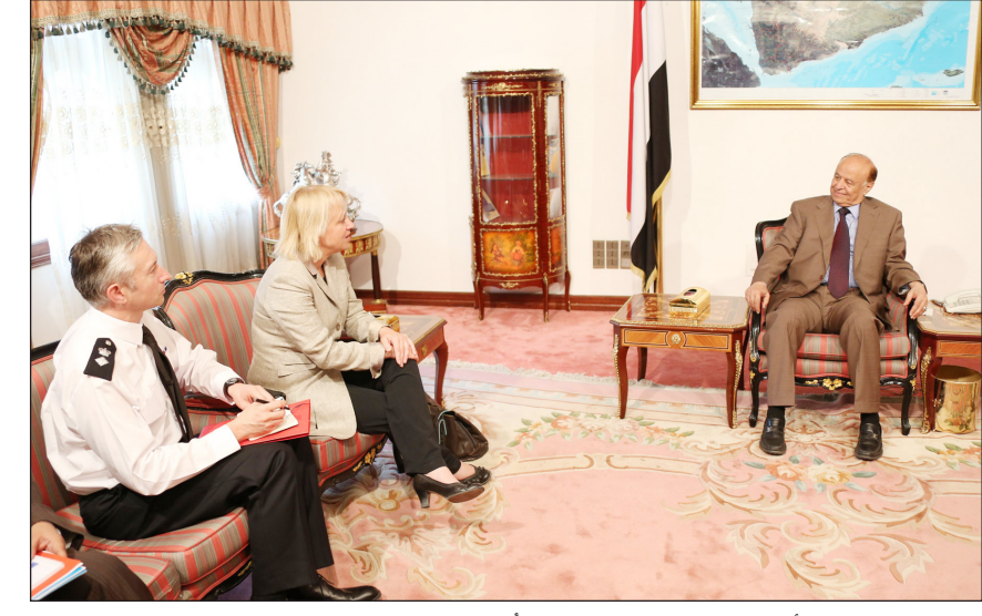
رئيس الجمهورية أثناء استقباله بعثة الاتحاد الأوروبي

صنعاء / سبأ: استقبل الأخ الرئيس عبد ربه منصور هادي رئيس الجمهورية، أمس في مكتبه بدار الرئاسة رئيسة بعثة الاتحاد الأوروبي السفيرة بتينا موشايت ، التي سلمت لالأخ الرئيس نسخة من توصيات مجلس وزراء خارجية الاتحاد الأوروبي حول اليمن . وتضمنت التوصيات : 1 - ترحيب الاتحاد الأوروبي بالتقدم المحرز حتى الآن في مؤتمر الحوار الوطني، ويعبر عن دعمه الكامل لعمله المتواصل ، ويؤكد على أهمية احترام الجداول الزمنية المتفق عليها لمؤتمر الحوار الوطني والمنصوص عليها في المبادرة الخليجية للسماح بإجراء الاستفتاء متبوعا بالانتخابات العامة ، وللقيام بذلك يدعو الاتحاد الأوروبي جميع المشاركين في الحوار الوطني للتسريع بالمسائل الاجرائية والتعامل مع القضايا الجوهرية على وجه السرعة . كما يرحب الاتحاد الأوروبي بتشكيل لجنة التوفيق، التي يتوقع أن تلعب دورا في إيصال مؤتمر الحوار الوطني إلى نهاية ناجحة وفي التوقيت المتفق عليه