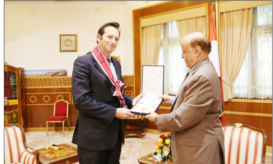
رئيس الجمهورية خلال استقباله نائب مستشار الأمن القومي البريطاني