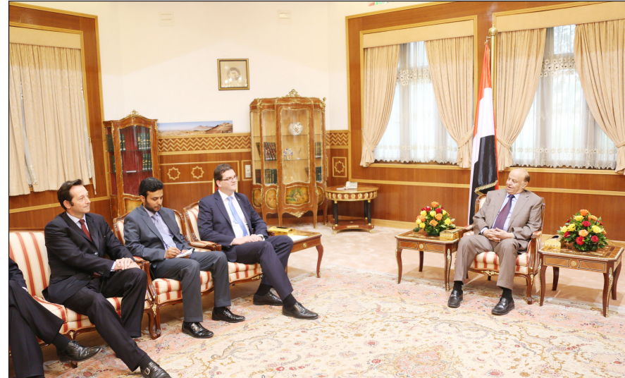
رئيس الجمهورية خلال استقباله نائب مستشار الأمن القومي البريطاني

صنعاء / سبأ: استقبل الأخ الرئيس عبدربه منصور هادي رئيس الجمهورية، أمس بمكتبه بدار الرئاسة نائب مستشار الأمن القومي البريطاني أولي روبسون ومعه سفير المملكة المتحدة البريطانية نيكولاس هوبتون . وفي بداية اللقاء رحب الأخ الرئيس بالمسؤول البريطاني الرفيع والوفد المرافق له ، وتناول التطورات والمستجدات على الصعيد التسويبي السياسية التاريخية في اليمن بمقتضيات المبادرة الخليجية وألياتها التنفيذية المزمدة وقراري مجلس الأمن رقم 2014 و 2011 ومرحلة تنفيذ بنودها منذ تشكيل الحكومة والانتخابات الرئاسية المبكرة وحتى إعادة هيكلة الجيش والوصول إلى الحوار الوطني الشامل الذي يمثل المحطة الإستراتيجية والجوهرية للتغيير الشامل والعميق في اليمن واما يلي طموحات الجماهير العريضة والأجيال القادمة ، ووفقا للمخرجات التي يشارك في صياغتها وتحديد مسارها وطبيعة اتجاهاتها كل القوى السياسية والاجتماعية والثقافية اليمنية بكل اتجاهاتها ومشاربها . وأشار الأخ الرئيس إلى أن الوضع الاقتصادي هو الأساس في الكثير من المشاكل والصعوبات التي يواجهها اليمن بمختلف أشكالها وصورها . وعبر الأخ الرئيس عبدربه منصور هادي عن تقديره البالغ لرئيس الوزراء البريطاني ديفيد كامرون وللحكومة البريطانية على الدعم والمساندة والاهتمام الكبير بشؤون اليمن خصوصا منذ نشوب الأزمة منذ مطلع 2011 .. منوها إلى أن بريطانيا