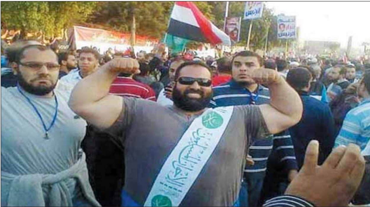
ميليشيات (الأخوان المسلمين) يستعرضون عضلاتهم في شوارع القاهرة