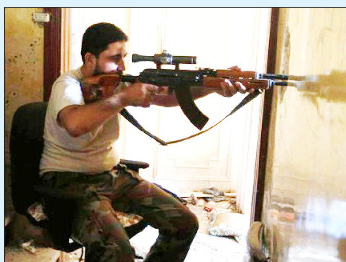
أحد عناصر مايسمى بالجهاديين في سوريا