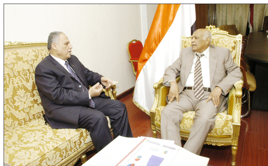
رئيس الوزراء لدى لقائه القائم بأعمال السفارة الليبية

■ صنعاء / سبأ: التقى رئيس مجلس الوزراء الأخ محمد سالم باسندوة أمس القائم بأعمال السفارة الليبية بصنعاء رمضان فرج بازامة.