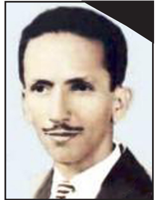
الشهيد/ عبدالباري قاسبي مؤسس صحيفة 14 أكتوبر