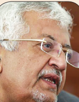
د. ياسين سعيد نعمان

بعض القوى السياسية تصرف مثل إخواننا الصوماليين في عدن قبل الاستقلال. كانوا يشككون جالية مغلقة تميز بالتعصب والفار. يا ويل يدخل صومالي في مشكلة إلا وتشوف الصوماليين قد جمعوا من كل مكان بمن فيهم حتى الذين قد نسوا أنهم صوماليين مع البواكير والعصى حقهم ويبدأون في التفسير والضرب لكل من يصادفهم ويحولون المدينة إلى حالة طوارئ، وإذا تجرأت وسالت أي واحد فيهم: إيش الحاصل؟ يرد عليك بقضب: أنا ما يعرف، شفت صومالي يضرب أنا اضرب، شفت صومالي يخبط أنا يخبط. وحسك تزيد الكلام. ولذلك فقد ظلت الجالية الصومالية مغلقة حتى تالتت في نهاية الأمر عندما ما تغيرت الظروف ولم تعد قادرة على مواصلة هذا السلوك فيما عدا القليل ممن اندمجوا في المجتمع.