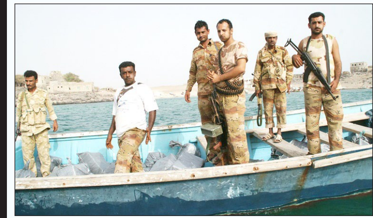
القارب الذي ضبط على متنه أسلحة مهربة في منطقة ذباب

أخرى من ضمنها سموم ومبيدات حشرية خطيرة، وحذر قائد محور تعز المهريين من مثل هذه الأعمال التخريبية التي لها انعكاسات مدمرة على الوطن، مؤكدا أن أبطال القوات المسلحة والمواطنين الشرفاء لن يسمحوا أبدا في الاستمرار بتخريب الوطن وإفلاق أمنه واستقراره وتهريب كل المحرمات والمنوعات إلى اليمن بهدف إشعال الفتنة وإفلاق السكينة العامة.