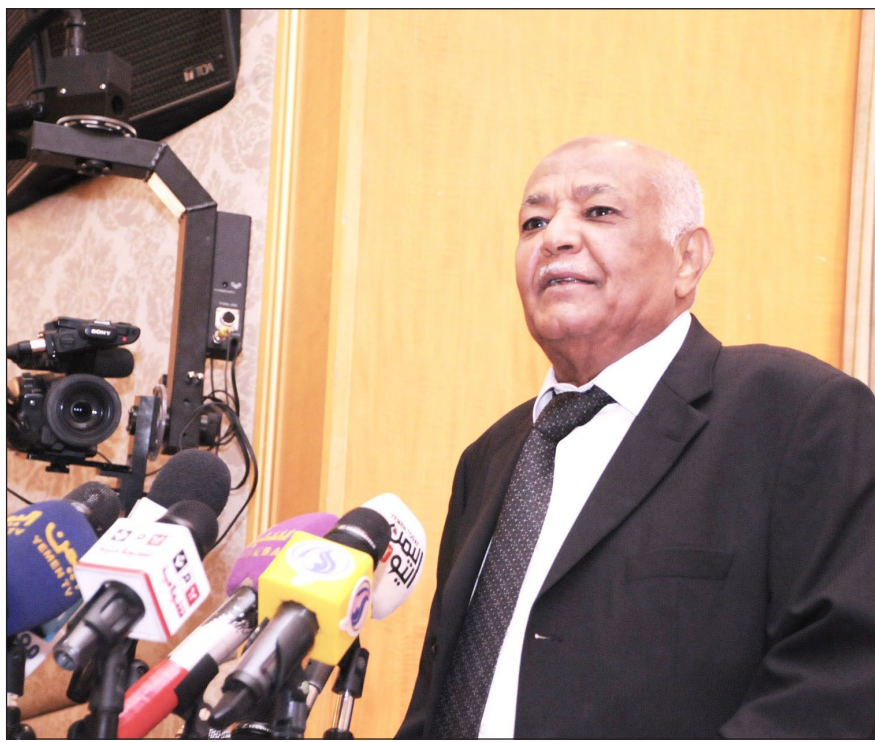
رئيس الوزراء خلال تدشين الحملة الوطنية لدعم مرضى السرطان

لأبناء الوطن وخاصة الفقراء.. ولفت الأخ باسندوة إلى المسؤولية التضامنية الرسمية والشعبية لدعم مرضى السرطان ماديا ومعنويا.. مشيرا إلى ما يمثل هذا الداء الخبيث من خطورة، فضلا عن تكاليف علاجه الباهظة وهو ما يتطلب تعاون الجميع لمساعدة من ابتلاه من الله بهذا المرض.