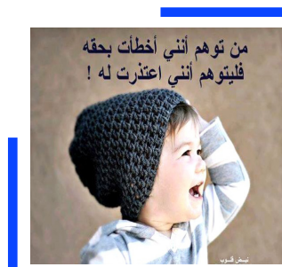
من توهم أنني أعطت بحقه فليتوهم أنني اعتدت له!