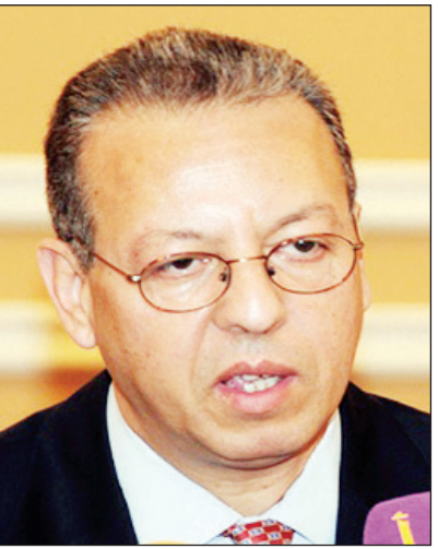
جمال بن عمر

الحديدة / سبأ، قال مبعوث الأمين العام للأمم المتحدة إلى اليمن جمال بنعمر "إن مسيرة التغيير في اليمن بدأت الآن والشباب هم من بدأ بهذا التغيير ويعد لهم الفضل في ذلك كون الأمل في بناء اليمن جديد معول عليهم". وأضاف بنعمر خلال لقائه قيادات أحزاب اللقاء المشترك "إن اليمن كان سيدخل حرباً أهلية لاهوادة فيها لكن بفضل الحكمة اليمنية تغلب اليمنيون على تلك الصعاب واليوم لديهم فرصة كبيرة للوصول إلى حلول أفضل عبر الحوار الوطني الشامل لبناء منظومة حكم جديدة ودستور يمني جديد". وأشار إلى أن صوت اليمنيين الآن مسموع وذلك عبر الحوار الوطني الشامل وأصبح العالم يعرف اليوم اليمني عبر أصوات إخوانكم المشاركين في مؤتمر الحوار الوطني الذي أطلعوا المتحاورين على كل احتياجات المحافظة والمنطقة. ولفت مبعوث الأمين العام للأمم المتحدة إلى اليمن إلى أن العقد الاجتماعي الجديد لليمن سيتم بنائه بمشاركة الجميع من خلال معركة التحدي التي دخلها اليمن والتي من خلالها سيثبت للعالم أن اليمنيين قادرين على بناء وطنهم بجهود وكفاءات أبنائهم المخلصين. وكان قيادات أحزاب اللقاء المشترك بالمحافظة تحدثوا خلال اللقاء حول تطلعات الجميع لبناء اليمن الجديد الذي يتطلع إليه أبناء الوطن خلال الفترة القادمة. التي أكد مبعوث الأمين العام للأمم المتحدة إلى اليمن جمال بنعمر أن هناك إجماعاً على الكثير من القضايا التي يجب معالجتها في اليمن وخاصة في الحديدة ومنها مشكلة الكهرباء والصرف الصحي والأراضي. وقال بنعمر خلال لقائه قيادات المؤتمر