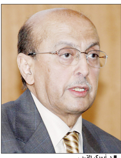
د. أبو بكر القربي

صنعاء / لؤي عباس، قال الدكتور أبو بكر القربي وزير الخارجية وعضو لجنة الحوار الوطني «إننا نعيش احتمالات ذرى الوحدة الثالثة بعد العشرين بمشاعر مختلفة.. إذ إننا نرى الحلم اليمني العظيم "الوحدة" يتعرض لمحاولات التشويه والإجهاض نتيجة جملة من العوامل المتداخلة التي تقف على رأسها إدارة عاجزة عن استيعاب المتغيرات أولا، ومحاولات الاستحواذ التي قام وما زال يقوم بها أصحاب المصالح من المنتهين لكافة ألوان الطيف السياسي والاجتماعي ثانياً.. وأضاف القربي في تصريح لصحيفة (14 أكتوبر): المؤسف حقاً أن يتم تحميل الوحدة الممارسات الخاطئة التي قام بها البعض من كل الأطراف والتي ظلت تتراكم ككرة الثلج في غياب تام لأي كواكب أو محاولات من قبل الجهات السنوية. وأكد القربي في سياق تصريحه: أننا نعيش اليوم تفاصيل مرحلة جد حساسة يجب أن تكون فيها على قدر المسؤولية، فإزواجية المعايير والمواقف الحاصلة وتحكم المصلحة الشخصية والانتماء الحزبي والطائفي والقبلي أمور تمثل مجمل الخطر الذي يتهدد وحدة اليمن الإنسانية والجغرافية، متسائلاً في ختام تصريحه "هل لنا أن