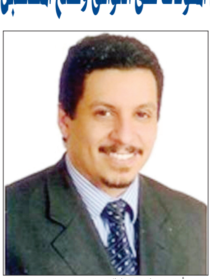
د. أحمد عوض بن مبارك

صنعاء / سبأ، اختارت المكونات المستقلة في مؤتمر الحوار الوطني الشامل ممثلة بمكونات الشباب، المرأة، منظمات المجتمع المدني، وقائمة رئيس الجمهورية) أمس ممثلها للتحديث عن القضايا التسع التي ستعرض على الجلسة العامة الثانية لمؤتمر الحوار ابتداء من السبت المقبل. وقد توافقت المكونات المستقلة على ترشيح ثلاثة أشخاص للحديث عن قضية واحدة، بحيث يصل عدد المتحدثين من كل مكون إلى 27 شخصاً للتعقيب على ما تضمنته التقارير المرفوعة من فرق العمل إزاء القضايا التسع. وقد اعتبر أمين عام مؤتمر الحوار الدكتور أحمد عوض بن مبارك في تصريح لوكالة الأنباء اليمنية (سبأ) عقد المكونات غير التنظيمية للقاءاتها أمس لاختيار ممثلها، يعد شكلاً من أشكال التنسيق بين المكونات ل طرح رؤاها بصورة مثلى حول مختلف القضايا في الجلسة العامة الثانية للمؤتمر. وأشار الدكتور بن مبارك إلى أن هذه الآلية تعمل على تنظيم عملية النقاش في الجلسة، حيث يسمى كل مكون ثلاثة من أعضائه لتقديم مداخلاتها حول كل قضية من القضايا التسع لما من شأنه ضمان أن تكون مداخلاتهم مركزة ومدروسة وتعبّر عن رؤية وتطلعات هذا المكون. وعن الأحزاب وممثلها للحديث في الجلسة العامة قال أمين عام مؤتمر الحوار إن "الأحزاب لديها آلية تنظيمية معينة ورؤية مختلفة وبالتالي آلية مداخلاتها داخل الجلسة ستكون وفقاً لخياراتها هي". موضحاً أن المكونات ستزود بالتقارير الخاصة بمخرجات فرق العمل إزاء القضايا التسع التي ناقشتها جميع الفرق، وبالتالي ستقبل طرحة خلال الجلسة العامة التصفية.