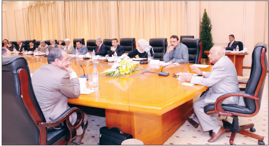
■ من اجتماع مجلس الوزراء أمس

المخدرات والادوية وغيرها.. مشيراً الى ان الضغوطات المتكررة في الأونة الأخيرة دليل على يقظة الأجهزة الأمنية والعسكرية وشروعها في مرحلة جديدة من عدم التهاون مع المهربين ايا كانوا. وتطرق التقرير الى الخطط الخاصة بوقف الاعتداءات المتكررة على أنابيب النفط وخطوط وإبراج نقل الطاقة الكهربائية، التي أحدثت مردودات سلبية على الوطن وأضررت بالاقتصاد والحياة العامة للمواطنين، وما تم إيجاده في هذا الجانب من إجراءات عسكرية وأمنية حازمة لمنع تكرار مثل تلك الاعتداءات، وكذا لردع من يقوم بمثل تلك الأعمال الإجرامية التخريبية والخارجة عن النظام والقانون.