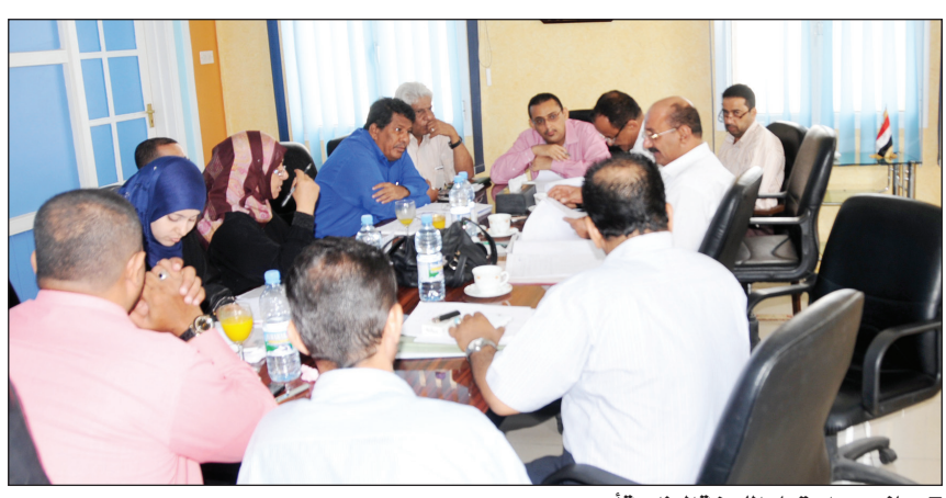
■ جانب من اجتماع اللجنة الوزارية أمس

وفي الاجتماع اوضح رئيس اللجنة الوزارية نائب وزير الشؤون القانونية أحمد المحروق ان اللجنة ستقوم بموافاة مجلس الوزراء بعد تواصلها مع كافة الجهات المعنية في المحافظة بمستوى تنفيذ القرارات مع التطرق لأي صعوبات أو عراقيل قد تواجه عمل اللجنة . وأشار إلى ان اللجنة استمعت من قيادة المنطقة الحرة بعدد لارائها ومقترحاتها بشأن قرار مجلس الوزراء .. منها بان اللجنة ستلتقي خلال الیومين القادمين بالجهات ذات الاختصاص وعلاقة بهدف الخروج برؤية شاملة تمكنهم من رفع تقريرهم الى مجلس الوزراء.