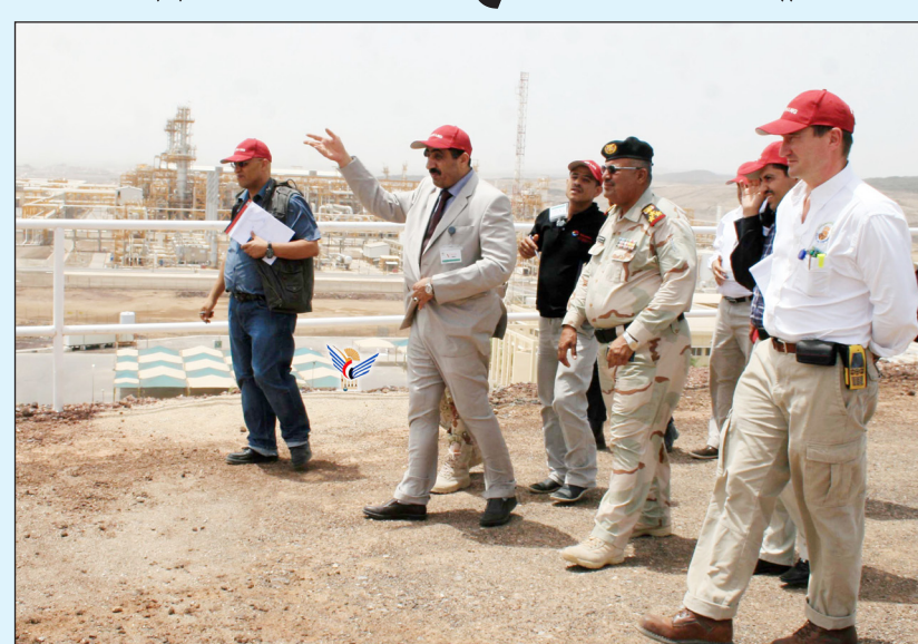
دارس أثناء تفقده مشروع الغاز المسال ببلحاف

كما اطلع على سير العملية التعليمية في أكاديمية الغاز الطبيعي المسال ببلحاف التابعة للشركة اليمنية للغاز الطبيعي المسال وما توفره الأكاديمية من فرص تعليمية تأهيلية وتدريبية سواء للعاملين في الشركة المتواجدين في موقع محطة المشروع أو لأبناء المحافظات الأخرى وعلى وجه التحديد أبناء محافظتي شبوة ومارب. واستمع الوزير دارس من القائمين على الأكاديمية إلى شرح حول طبيعة العملية التعليمية في الأكاديمية... حيث أوضحوا أن الأكاديمية تمنح الدبلوم