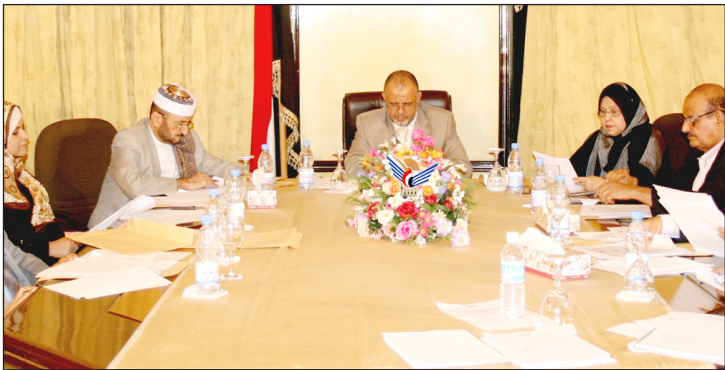
اجتماع اللجنة العليا للانتخابات والاستفتاء

العلاقات الخارجية وتتولى العديد من المهام منها إنشاء قاعدة بيانات خاصة بما يتعلق بالمغتربين اليمنيين البالغين لسن القانونية المتواجدين في شتى بلدان العالم والعمل على تحديثها بصورة مستمرة. كما اطلعت اللجنة على عدد من التقارير المرفوعة إليها وأقرت استكمال اللجنة . ووافقت اللجنة على إنشاء إدارة تصويت المغتربين وتتبع قطاع