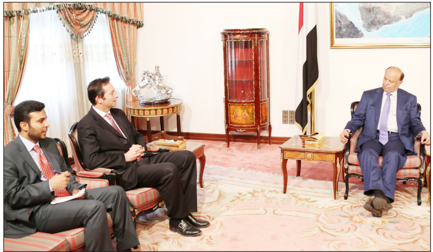
رئيس الجمهورية لدى استقباله السفير البريطاني

الرئيس يبحث مع السفير البريطاني الخطوات المنجزه من التسوية السياسية