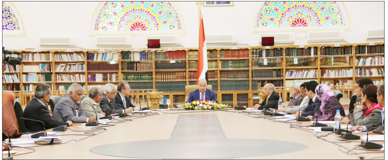
رئيس الجمهورية خلال ترؤسه اجتماع لجنة التوفيق أمس

وأكد الأخ الرئيس عبد ربه منصور هادي ان اليمن يمضي صوب الأمن والأمان .. مشيراً الى ان اليمن في العام الماضي وخلال الاحتفالات بالعيد الوطني الـ 22 للجمهورية اليمنية 22 مايو فوجئاً بأكثر عملية إرهابية وإجرامية اودت بالآلاف من القتلى والجرحى بينما كان الجنود يحضرون في بروقات للعرض العسكري في الواحد