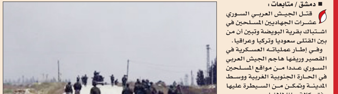
■ الجيش السوري يواصل تطهير المناطق من الارهابيين

■ دمشق / متابعات: قتل الجيش العربي السوري عشرات الجهاديين المسلحين في اشتباك بقوية البويضة وتبين أن من بين القتلى سعوديا وتركيا وعراقيا .. وفي إطار عملياته العسكرية في القصير وريفها هاجم الجيش العربي السوري عدداً من مواقع المسلحين في الحارة الجنوبية الغربية وسط المدينة وتمكن من السيطرة عليها وفق وكالة سانا للأنباء .. وواصل الجيش السوري ملاحقة المسلحين في ريف دمشق حيث دخل إلى بلدات سكا وتل سكا والدبية والمنصورة في الغوطة الشرقية بعد معارك مع مجموعات المعارضة الجهادية المسلحة .. كما دمر الجيش نفقا يصل بين بلدة حرستا والطريق الدولي الذي يربط العاصمة دمشق بمدينة حمص .. وأكد مسؤول عسكري سوري السيطرة على كل الأبنية المشرفة على طريق مطار دمشق في بلدة بيت سحم بعد اشتباكات مع المسلحين .. وفي ريف حلب بدأ الجيش السوري عملية حول مطار منغ هي الأولى ضمن خطة لإنهاء وجود الجماعات المسلحة في الشمال السوري .. من جانب آخر، واصلت الجماعات