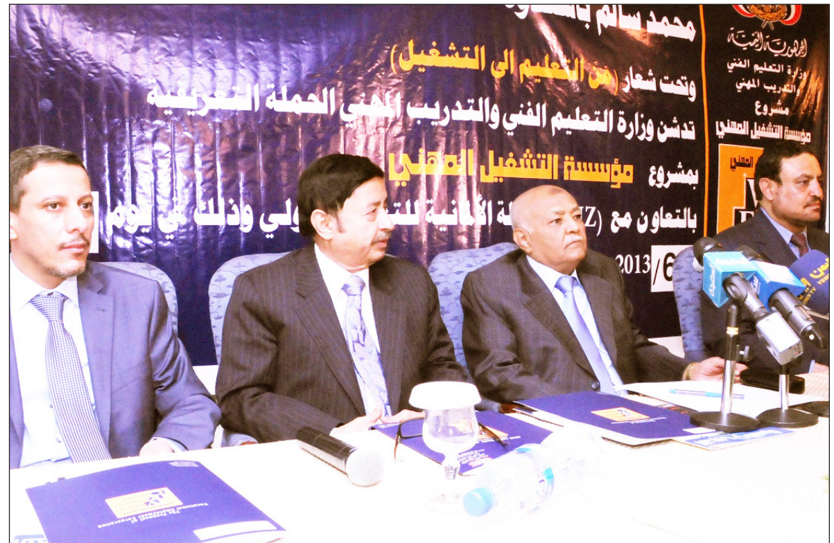
■ رئيس الوزراء خلال تدشين مشروع إنشاء مؤسسة التشغيل المهني للشباب والشابات

■ صنعاء / سبأ: أكد رئيس الوزراء الأخ محمد سالم باسندوة أن من حق الشباب أن يكون الحاضر والمستقبل لهم، فهم صناع التغيير الذي يعيشه اليمن .. مشدداً على ضرورة تعاون الجميع من أجل بناء واقع ومستقبل أفضل للجيل القادم .. جاء ذلك خلال تدشينه أمس الحملة التوعيفية لمشروع إنشاء مؤسسة التشغيل المهني للشباب والشابات، بمشاركة عدد من الجهات الحكومية والقطاع الخاص والمناخين وخريجي التعليم الفني والمهني، وعبر رئيس الوزراء في كلمته التي القاها في حفل التدشين عن امه في أن تمثل هذه المؤسسة، خلال الفترة القادمة، إطاراً تكوينياً مهماً للشباب والشابات الخريجين من معاهد التعليم الفني والتدريب المهني المنتشرة على امتداد اليمن، يحفزهم إلى تبني مشاريعهم الخاصة، ويهدم بالاستشارات اللازمة لإنجاح مشاريعهم ويصطحبهم في مرحلة التأسيس، ويشكل واسطة موثوقة بين المشاريع ومصادر التمويل المتاحة .. وجه الأخ باسندوة وزارة التعليم الفني بأهمية الحرص على استكمال البنية الأساسية لمشروع مؤسسة التشغيل المهني، لتكون المؤسسة جاهزة لتقديم الخدمات لأبنائنا الخريجين من التقنيين والمهنيين، بما يتطابق مع الأهداف التي أنشئت المؤسسة من أجلها .. انفصائل ص11