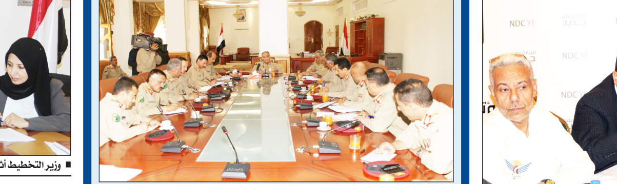
■ وزير الدفاع خلال ترؤسه اجتماع قيادات وزارة الدفاع

■ صنعاء / سبأ: رأس وزير الدفاع اللواء محمد ناصر أحمد امس وبحضور رئيس هيئة الأركان العامة اللواء أحمد علي الأشول والمتش العام للقوات المسلحة اللواء الركن محمد علي القاسمي اجتماعاً ضم نائب رئيس هيئة الأركان العامة اللواء الركن عبدالباري الشميري ومساعد وزير الدفاع ورؤساء الهيئات التخصصية وعدد من مدراء الدوائر .. وفي الاجتماع أكد وزير الدفاع على سرعة بناء العمل المؤسسي العسكري على أساس اللامركزية والتخصص ووضع المهام والواجبات والصلاحيات وبما يضمن تصحيح الإدارة ومحاربة الفساد والروتين لتكون القوات المسلحة نموذجاً للإدارة الخالية من كل أشكال الفساد ..