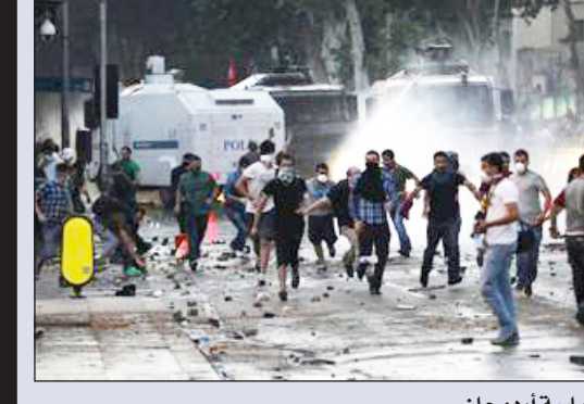
■ من الاحتجاجات ضد سياسة أردوغان

■ أنقرة / متابعات: دعا الرئيس التركي عبد الله غول أمس السبت إلى تغليب "المنطق" فيما وصلت الاحتجاجات العنيفة ضد مشاريع بناء في ساحة تقسيم وسط اسطنبول إلى "حد مقلق" .. وقال غول في بيان نشره مكتبه "يتعين علينا جميعاً أن نحلح بالنضج حتى يمكن للاحتجاجات، التي وصلت إلى حد مقلق، أن تهدأ" .. ودعا الشرطة إلى "التصرف بشكل متناسب" مع حجم الاحتجاج .. وفي وقت سابق، أكد رئيس الوزراء التركي، رجب طيب أردوغان أنه لن يساوم بشأن مشروع البناء الذي كان وراء اندلاع تظاهرات "تقسيم" في اسطنبول .. وشدد على أنه سيمضي قدماً في خطط إعادة تنمية ميدان تقسيم وسط اسطنبول رغم الاحتجاجات التي انطلقت منذ الاثنين، وأصيب فيها المئات، وأضاف متحدثاً بعد أعنف اشتباكات منذ أعوام بين شرطة مكافحة الشغب ومتظاهرين مناهضين للحكومة، إن خطط إعادة التنمية تستخدم كمبرر لإدعاء التوترات ..