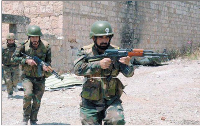
جنود سوريين يمشطون الحدود مع لبنان