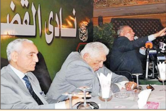
من التسلسل إلى صرح العدالة الشامخ، ذلك كله وغيره نتيجة حتمية للقانون المشبوه.

وأضافت اللجنة في بيان لها أمس الجمعة، أن هذه التعديلات تستهدف استبدال شيوخ القضاء بمن لا علم لهم ممن ينتمون إلى جماعة الإخوان المسلمين وتوابعهم حتى يصبح قضاء مصر الشامخ خصوصا بالجماعة يطبق فيه السمع والطاعة ليتمكنوا من الحصول على أحكام توافق أهواءهم للتخلص من خصومهم، وتزوير الانتخابات، والتهم مصر، واستكمال مخططاتهم في التمكين، وصولا إلى أخوة القضاء من خلال من سيمكنونهم