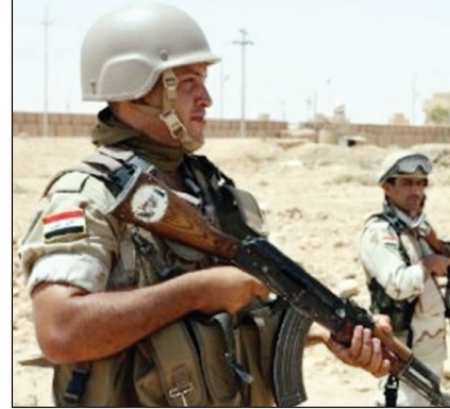
أفراد من الجيش العراقي

صنعاء / سبأ، أعلن الجيش العراقي، أمس السبت، أنه اشترك مع عناصر من تنظيم القاعدة في الأنبار، غرب البلاد، وسط انباء عن سقوط قتلى وجرحى بين صفوف المسلحين. وقطع الجيش الطريق الدولي عند منطقة الـ160 كيلومترا غرب الرمادي، فيما حلت مروحيات الجيش في بداية الأنبار، بحثا عن أوكر تنظيم القاعدة. وشارك 20 ألف جندي في العملية، وعززوا انتشارهم على طول الحدود العراقية السورية لمنع التسلسل، بحسب ما أفاد السبب مسؤول عسكري رفيع المستوى. وقال الفريق الركن علي غيدان «أطلقنا عملية أمنية كبيرة للألحقة عناصر القاعدة الذين يقومون بعمليات خطف وتهديد للقوات الأمنية والمواطنين، وأسفرت العملية، بحسب غيدان،