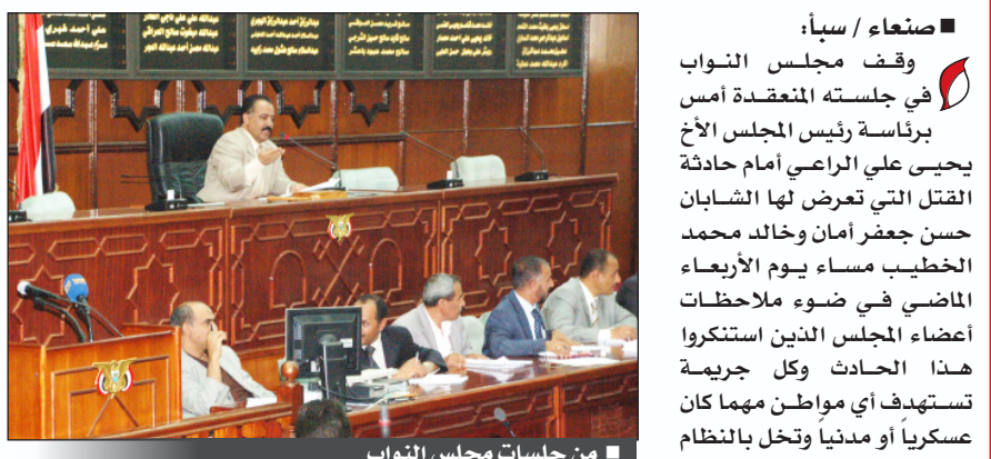
من جلسات مجلس النواب

البرلمان يطالب بالقبض على قتلة الشابين أمان والخطيب وتقديمهم للعدالة