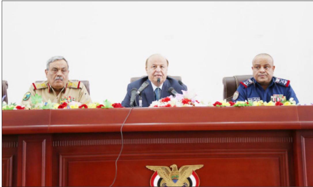
رئيس الجمهورية في محاضرة أمام منتسبي القوات الجوية والدفاع الجوي

صنعاء / سبأ: استقبل الأخ الرئيس عبدربه منصور هادي رئيس الجمهورية أمس سفير الولايات المتحدة الأمريكية بصنعاء جيرالد فاير ستاين. وجرى خلال اللقاء مناقشة عدد من القضايا والموضوعات المتعلقة بالعلاقات الثنائية بين البلدين الصديقين وطبيعية وأهداف تمديد الأمر التنفيذي للرئيس باراك أوباما وفقا للسلطة المخولة له وقوانين الولايات المتحدة الأمريكية والمتضمنة قانون القوى الاقتصادية وقانون الطوارئ الوطني والهادفة إلى تجميد الأصول والمصالح والممتلكات في الولايات المتحدة وغيرها ضد الذين يثبت عرقلتهم للمبادرة الخليجية وألياتها التنفيذية الزمنية والانتقال السياسي السلمي للسلطة في اليمن وبما يليب تطعات الشعب اليمني من أجل التغيير. ويعتبر القانون المعرقل للعملية السياسية في اليمن يشكلون تهديدا غير عادي واستثنائيا للأمن القومي والسياسة الخارجية للولايات المتحدة الأمريكية وبذلك أعلن