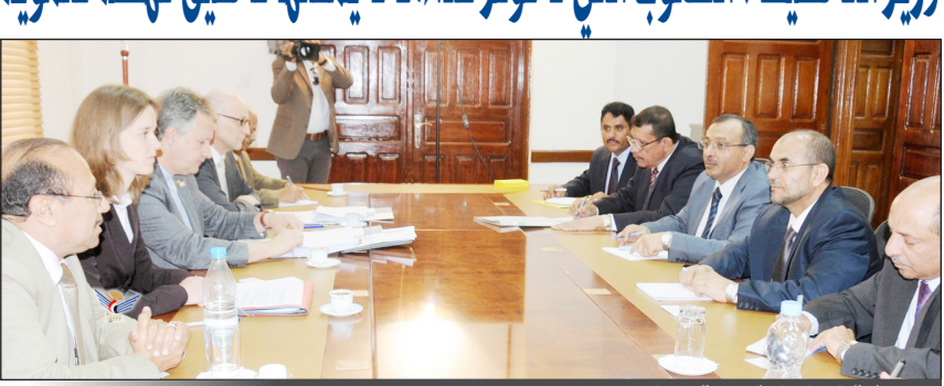
ورشة العمل التشاورية مع المانحين

وزير التخطيط: الشعوب التي لا توفر غذاءها لا يمكنها تحقيق نهضة تنمية