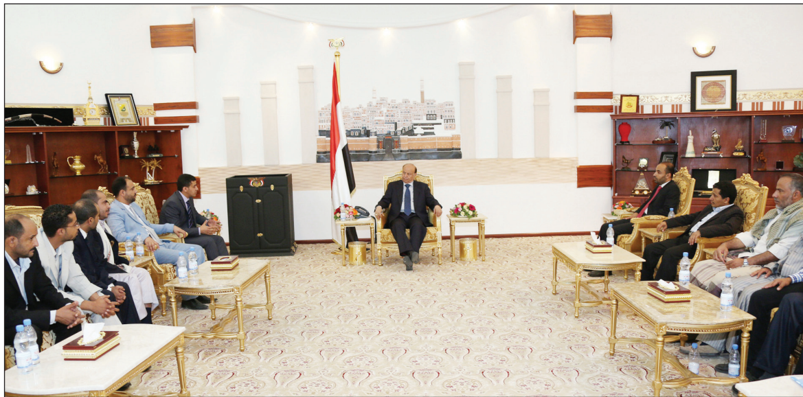
رئيس الجمهورية لدى استقباله اللجنة التحضيرية للمؤتمر الوطني للشباب

بعث الأخ الرئيس عبد ربه منصور هادي رئيس الجمهورية برقية تهنئة إلى جلالة الملك هارالد الخامس ملك مملكة النرويج بمناسبة احتفالات الشعب النرويجي باليوم الدستوري.