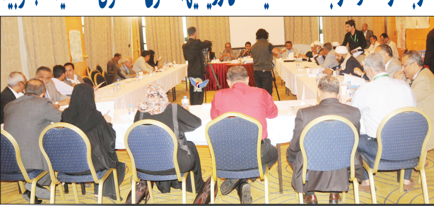
فريق عمل القضية الجنوبية