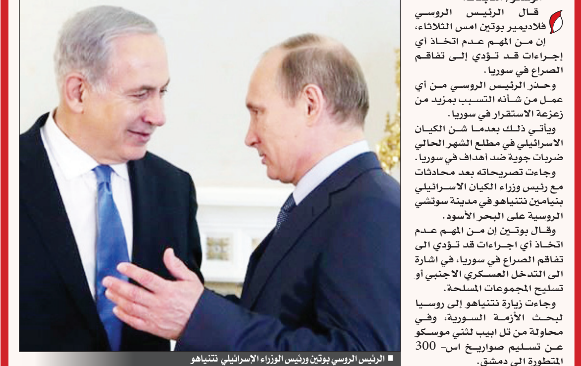
الرئيس الروسي بوتين ورئيس الوزراء الإسرائيلي نتنياهو

موسكو/ متابعات: قال الرئيس الروسي فلاديمير بوتين امس الثلاثاء، إن من المهم عدم اتخاذ أي إجراءات في سوريا، في إشارة إلى التدخل العسكري الاجنبي أو تسليم المجموعات المسلحة. وجاءت زيارة نتنياهو إلى روسيا لبحث الأزمة السورية، وفي محاولة من تل ابيب لثني موسكو عن تسليم صواريخ اس-300 المتطورة إلى دمشق.