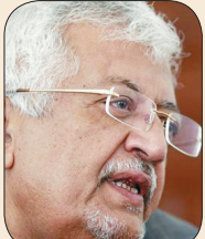
د. ياسين سعيد نعمان

التعيينات في الأجهزة المركزية تحتاج إلى ضوابط ومعايير تقنع الناس بأننا نسير فعلاً نحو بناء دولة عادلة وأن اليمنيين مؤهلون لذلك. لا تكمن المسألة في التغيير لمجرد التغيير ما لم يحمل التغيير دلالات يفهم منها أن التغيير يتم نحو الأفضل وبما يحقق فعلاً بناء هذه الدولة المنشودة.