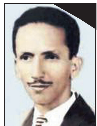
الشهيد/ عبدالباري قاسم مؤسس صحيفة 14 أكتوبر