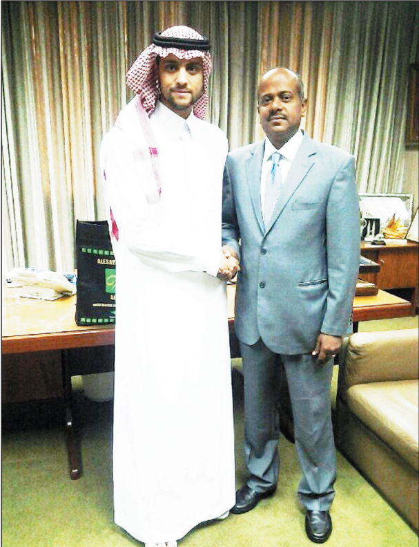
استقبل سمو الأمير عبدالعزيز بن فهد بن عبدالله آل سعود / رئيس الاتحاد العربي للسياحة بمكتبه بالعاصمة السعودية الرياض، صباح أمس الأول الأخ خالد محسن الخليفي رئيس الاتحاد اليمني للسياحة والألعاب المائية في لقاء خاص تم الترتيب له من قبل الأمانة العامة في الاتحاد السعودي من خلال مشاركة بلادنا في انتخابات الاتحاد العربي التي جرت في الشهر الماضي في العاصمة العمانية مسقط.

اللقاء الذي حمل طابعاً ودياً وارتبط بها جس مشترك ومر من بين العلاقات الأخوية التي تربط الشعبين الشقيقين حمل نقاشاً مطولاً قدم فيه الخليفي شرحاً وافياً عن لعبة السياحة في اليمن ومساغها لتخطو نحو مستقبل أفضل رغم المعاناة التي تعيشها في ظل غياب بنية تحتية.. من جانبه أكد سمو الأمير عبدالعزيز استعداده الكامل لإرساء مساحة أخرى يتم من خلالها توطيد العلاقة بين الأشقاء سياحياً المملكة واليمن في الفترة القادمة من خلال تعاون متواصل تقدم فيه السعودية دعمها الكامل للاتحاد اليمني في مجال التأهيل والتدريب والمعسكرات الخارجية، للارتقاء بما لديه من كوادر تكون عوناً له في قادم الفترات ليطور من حضوره وقدراته الفنية.. كما وعد الأمير بتقديم كل خبرات الاتحاد السعودي متى ما احتاجها منتسبو لعبة السياحة اليمنية.