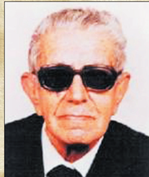
عبد الله القصيمي

السعادة هي مقدار التوافق مع الظروف ومع النفس.