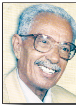
محمد سعد عبدالله

■ عدن / سياً: شارك عدد من الأدباء والفنانين والمثقفين في الفعالية الفنية والثقافية التي أقيمت مساء أمس الأول بعدن عن إبداعات الفنان الراحل محمد سعد عبدالله . الفعالية التي نظمتها السلطة المحلية بمديرية الشيخ عثمان وكتب الثقافة في المديرية بمناسبة الذكرى الحادية عشرة لرحيل الفنان الكبير محمد سعد عبدالله، قدمت خلالها عدد من الفقرات الفنية لعدد من الفنانين والباحثين التي نوهت بتجربة الفنان محمد سعد عبدالله وخصوصيته الفنية وأعماله الغنائية وألوان الغناء اليمني في إبداعاته إلى جانب الأغنية الوطنية. شارك في الفعالية التي حضرها عدد من أعضاء السلطة المحلية والمنتديات الثقافية بعدن الكاتب والناقد الفني السعودي أحمد المهندس .