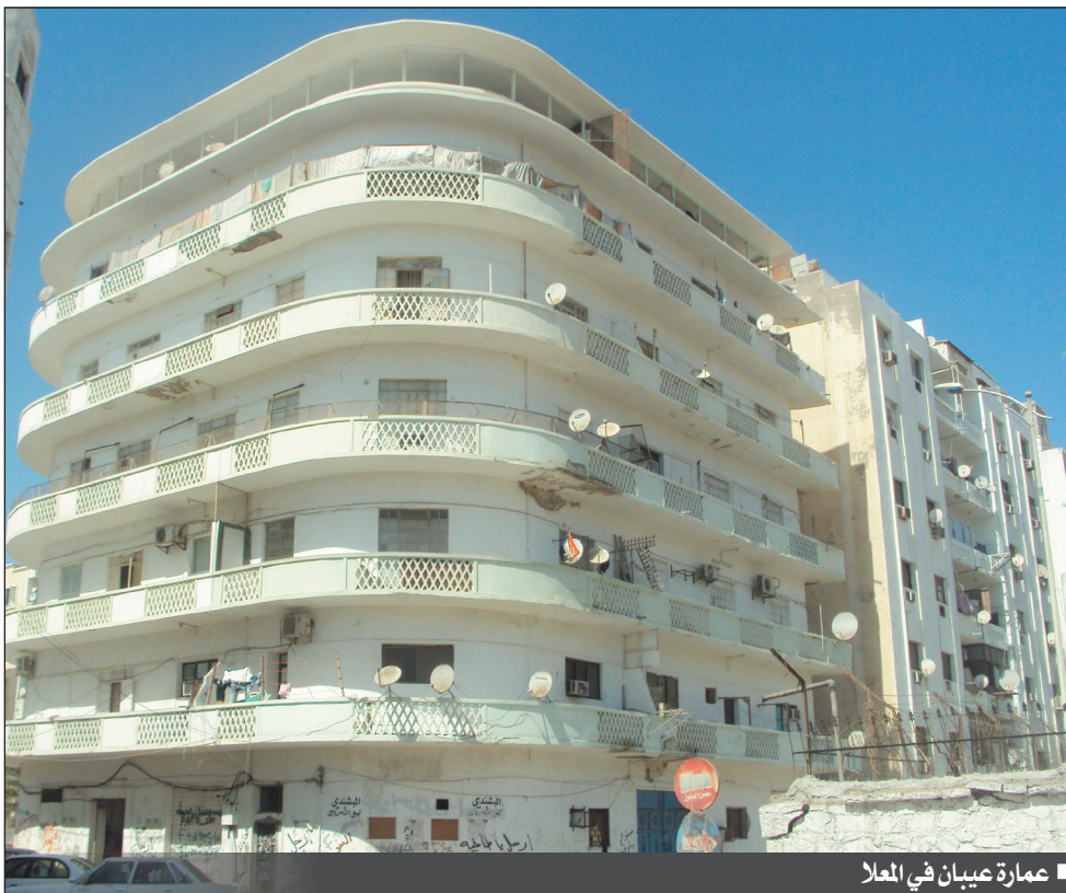
عمارة عيبان في المعلا