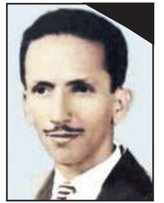
الشهيد/ عبدالباري قاسم مؤسس صحيفة 14 أكتوبر