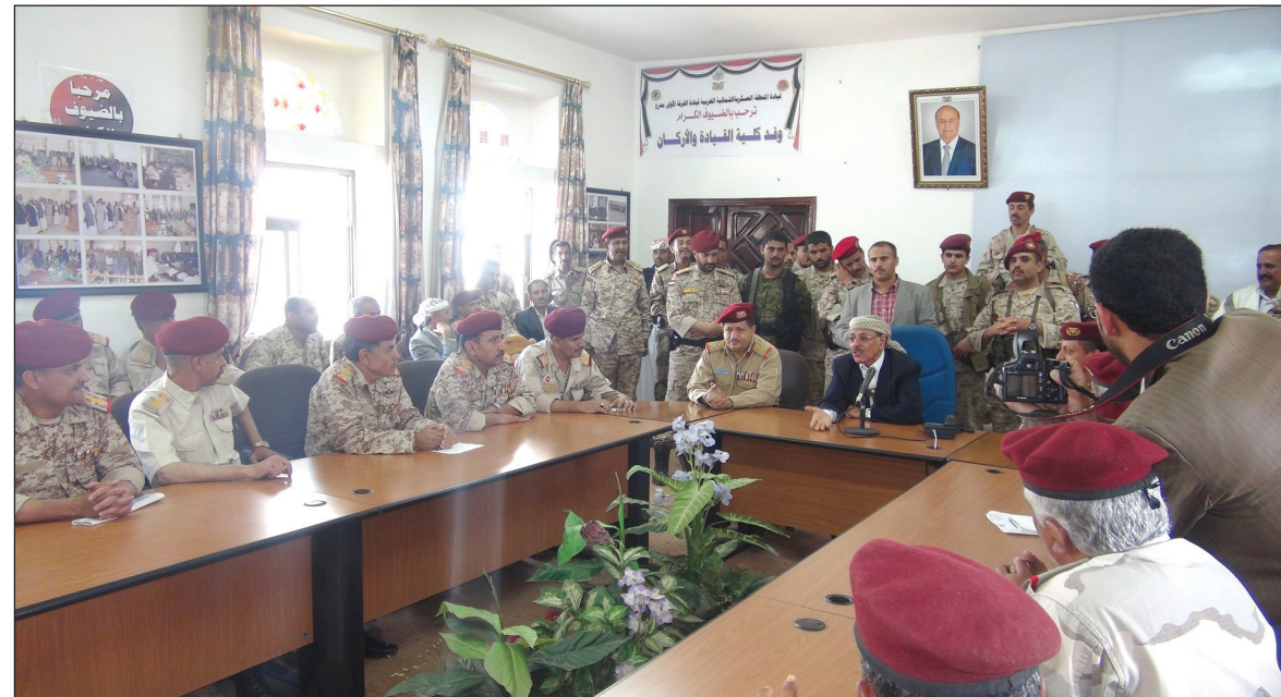
خلال اجراءات الاستلام والتسليم بين قائد المنطقة العسكرية الشمالية الغربية وقائد المنطقة العسكرية السادسة

■ صنعاء / سبأ : تواصلت لليوم الثاني توالي اجراءات الاستلام والتسليم بين قائد المنطقة العسكرية الشمالية الغربية سابقا ورئيس الجمهورية اللواء الركن علي محسن صالح وبين قائد المنطقة العسكرية السادسة اللواء الركن محمد علي المقدشي. وأوضح رئيس اللجنة الإشرافية على دور الاستلام والتسليم