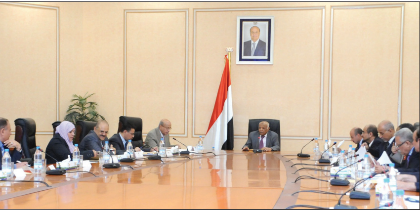
باسندوة لدى ترؤسه الاجتماع امس

■ صنعاء / سبأ : استعرض مجلس إدارة الجهاز التنفيذي لتسريع استيعاب تعهدات المانحين، في اجتماعه امس برئاسة رئيس الوزراء رئيس مجلس الادارة الاخ محمد سالم باسندوة، التقدم المحرز في اجراءات تخصيص تعهدات المانحين لليمن والمعلنة في الرياض ونيويورك في سبتمبر 2012م.