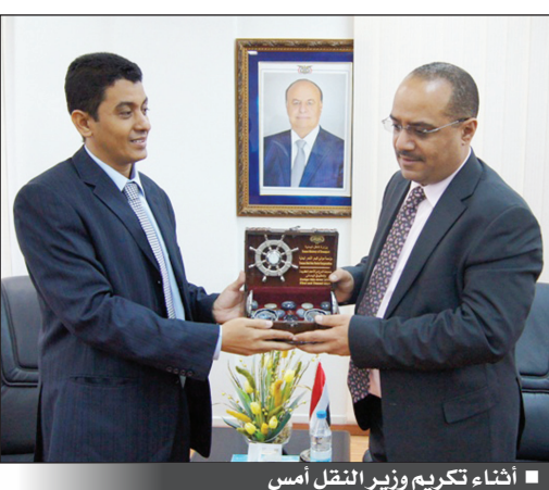
إنشاء تكريم وزير النقل أمس

■ صنعا / 14 أكتوبر: كرمت مؤسسة موانئ البحر الأحمر اليمنية امس بصنعا وزير النقل الدكتور واعد عبدالله باذيب نظير جهوده في تطويرها . وقدم القبطان محمد ابو بكر اسحاق الرئيس التنفيذي للمؤسسة للوزير باذيب فيما قدم مدير عام الحوايات ومدير عام الشؤون المالية بميناء الحديدة درعين آخرين . وفي التكريم الذي تم في الديوان امس عبر وزير النقل الدكتور واعد باذيب عن شكره للمؤسسة وقياداتها وموظفيها واعتبر ما تم انجازه من اعمال خلال العام الماضي واجبا وطنيا مؤكدا مواصلة جهوده في دعم النقل اليمني وتطوير مختلف قطاعاته. من جانبه قال محمد اسحاق ان الدرغ المقدمة من المؤسسة تعبر عن شكر وعرفان المؤسسة وموظفيها وعمالها للدكتور واعد باذيب نظير ما قدمه للمؤسسة من دعم ومساندة خلال العام الماضي وكذا تقدير لجهوده التي تكفلت بتطوير اعمال المؤسسة والموانئ التابعة لها وفي مقدمتها ميناء الحديدة الذي حقق طفرة كبيرة في اوائه وايراداته خلال العام 2012 .