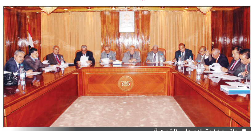
جانب من اجتماع مجلس الشورى أمس

بهم قرارات جمهورية مؤخرا، وكذا من يخل ترشيحهم بمعيار الفترة الزمنية في وظائف هيئة مكافحة الفساد وهيئة المناقصات والمزايدات. وشرح التقرير مراحل عمل اللجنة منذ تشكيلها وخلصه الاجتماعات التي عقدتها في هذا الشأن. وجررت مناقشات مستفيضة للتقرير، قدرت جميعها الجهود التي بذلتها اللجنة الشورية الخاصة بالبت في طلبات الترشيح. وتواصل اللجنة اجتماعاتها لاستكمال أعمالها اليوم الاربعاء.