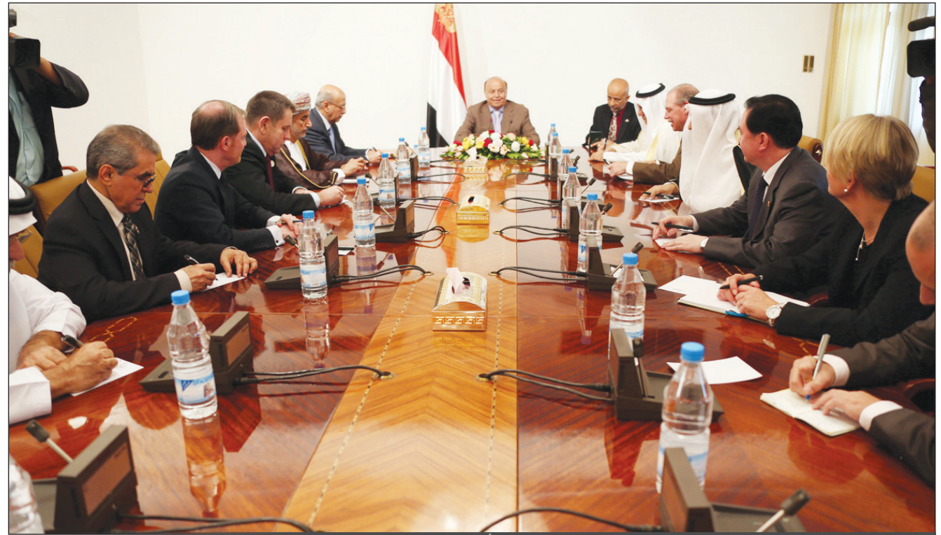
رئيس الجمهورية لدى استقباله سفراء الدول الراعية للمبادرة الخليجية أمس

■ صنعا / سيا: استقبل الاخ الرئيس عبدربه منصور هادي رئيس الجمهورية صباح أمس في دار الرئاسة وزير دولة قطر للشؤون الخارجية الدكتور خالد بن محمد العتيبة والوفد المرافق له الذي وصل الى صنعا في زيارة دعم ومساندة اخوية لليمن . وفي مستهل اللقاء رحب الاخ الرئيس بالوفد القطري .. معبرا عن تقديره لسمو امير دولة قطر الشقيقة حمد بن خليفة آل ثاني وولي العهد تميم بن حمد للتفهم الكبير الذي ابدياه تجاه المتطلبات الخاصة لبعض من المعالجات المطلوبة والتي تحتاج الى تمويلات مالية وكذلك موضوع