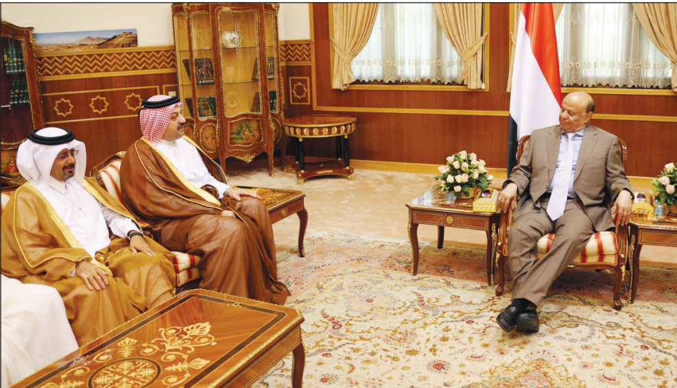
الرئيس لدى استقباله وزير دولة قطر للشؤون الخارجية أمس

الطاقة الكهربائية في محافظة عدن . ونوه رئيس الجمهورية بتفهم سمو الامير حمد، للضغوطات التي يعاني منها اليمن في الجوانب الامنية والسياسية والاقتصادية وما يحتاج ذلك من جهود من اجل تجاوز هذه الصعوبات والانتقال إلى واحة الامان والاطمئنان والتطور والازدهار .