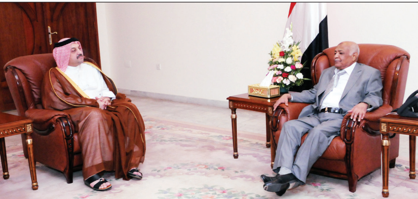
رئيس الوزراء لدى استقباله وزير دولة قطر للشؤون الخارجية أمس