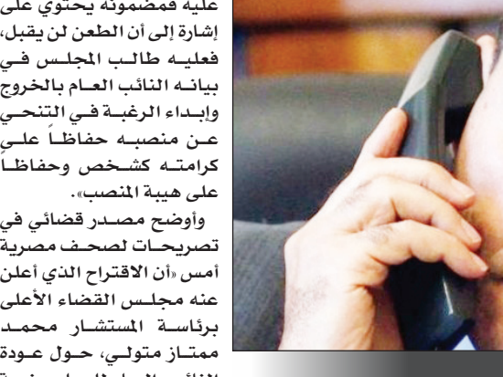
المستشار طلعت عبدالله

القاهرة/ متابعات: أشارت مطالبة المجلس الأعلى للقضاء في مصر للنائب العام المستشار طلعت عبدالله بالعودة إلى منصة القضاء جديداً وزادت موقفه من البقاء في منصبه الحالي غموضاً بعد الحكم الصادر ضده بإعلان تعيينه. فنيماً رُحِبَ نادي قضاة مصر بالبيان اعتبر المستشار أحمد النجار، رئيس محكمة بورسعيد، أن البيان غير الأمور التباساً، وقال لوقع «العربية نت»، إن «البيان غير كاف فهو لم يحسم بعد قضية النائب العام ولم يقل لنا إن الحكم بإعلان تعيين النائب العام بقرار جمهوري واجب النفاذ أم لا». وأضاف «كما أن هذا الالتباس يجعل الشارع المصري طرفياً في النزاع لا طائل منه، فهازالت أزمة النائب العام قائمة رغم مطالبة مجلس القضاء الأعلى للنائب العام بالعودة إلى منصة القضاء». ولكن محافظ أبوسعدة، رئيس المنظمة المصرية لحقوق الإنسان، أكد أن «أهم ما جاء فيه ما يفهم منه مضموناً أن المجلس أقر بإعلان تعيين النائب العام الحالي حتى ولو