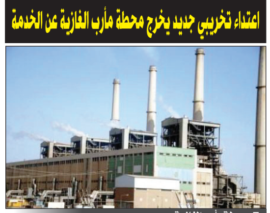
محطة مارب الغازية