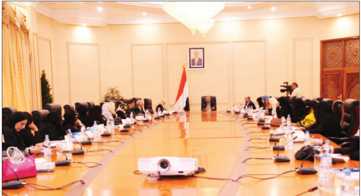
باستدرة خلال ترؤسه اجتماع المجلس الأعلى للمرأة

والقطاعات المحلية والدولية، إضافة إلى تعزيز مشاركة المرأة في مواقع صنع واتخاذ القرار. كما تشمل الخطة المجهزة بإجراءات مقترحة وبرامج زمنية لتنفيذ هذه الأهداف ومؤشر التحقق، تطوير أداء اللجنة وفروعها والمساهمة في متابعة وتقييم مؤتمر الحوار السنوي للجنة من بينها تعزيز مكون النوع الاجتماعي في السياسات العامة والبرامج الحكومية المركزية والمحلية، وإدماج مفهوم النوع الاجتماعي في الموازنات العامة والقطاعية للدولة، وتطوير علاقات الشراكة مع الجهات