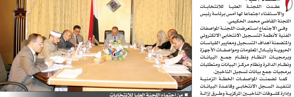
من اجتماع اللجنة العليا للانتخابات

صنعاء / سبأ : عقدت اللجنة العليا للانتخابات والاستفتاء اجتماعاً لها أمس برئاسة رئيس اللجنة القاضي محمد الحكيمي. وفي الاجتماع استعرضت اللجنة المواصفات الفنية لأنظمة التسجيل الإلكتروني والمتضمنة أهداف التسجيل ومعايير القياسات الحيوية وتبادل المعلومات ومواصفات الأجهزة وبرمجيات النظام ونظام جمع البيانات ونظام الدائرة ونظام مركز البيانات ومتطلبات برمجيات جمع بيانات تسجيل الناخبين. كما تضمنت المواصفات الخطة الزمنية لتنفيذ السجل الانتخابي وقاعدة البيانات وإدارة كشوفات الناخبين المركزية وطرق إزالة التكرار والارتباط بمنصة مطابقة نظام التعرف الحيوي التلقائي وألية الاختيار والتشغيل التجريبي لتنفيذ السجل الانتخابي. هذا وقد أجلت اللجنة إقرارها للمواصفات