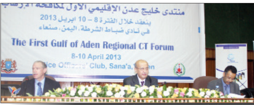
القربي خلال افتتاحه منتدى خليج عدن لمكافحة الإرهاب

حلول مستدامة. وشهد على ضرورة التعاون الإقليمي والدولي والتنسيق أهمية تضافر الجهود على المستويين الإقليمي والدولي لمكافحة الإرهاب وحماية الأرواح والممتلكات وحفظ المجتمع من مخاطر الإرهاب لاسيما في منطقة خليج عدن التي تمثل على أهم الممرات المائية الحيوية في العالم، ويمر عبرها 70 بالمائة من التجارة العالمية. وأشار وزير الخارجية لدى افتتاحه أمس بنادي ضباط الشرطة بصنعاء "منتدى خليج عدن الإقليمي الأول لمكافحة الإرهاب" الذي ينظمه على مدى ثلاثة أيام مركز سبأ للدراسات الاستراتيجية بالتعاون مع وزارة الخارجية والسفارة الأمريكية بصنعاء، إلى أهمية انعقاد المنتدى في الوقت الراهن، ودوره في تعزيز الجهود المبذولة في سبيل مكافحة الإرهاب عبر تبادل الآراء والخبرات واستعراض تحديات التطرف والإرهاب في منطقتنا وكيفية مواجهتها للوصول إلى معالجات