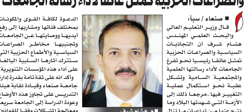
م. هشام شرف

الدعوة لكافة القوى والمكونات بمختلف فئاتها ومشاريها إلى رفع أيديها ووصايتها عن الجامعات وتجنّبها مخاطر الصراعات السياسية والأطماع الحزبية التي ستترك آثارها السلبية البالغة على أداء هذه المؤسسات التنويرية. وأكد أنه على ثقة تامة بقدرة إدارة جامعة صنعاء وقيادة نقابية هيئة التدريس على تجاوز هذه الأوضاع وعودة الدراسة إلى الجامعة سريعاً ومعالجة المشكلات وفقاً للقوانين واللوائح النافذة، كما جدد في نفس الوقت حرص الوزارة على تحقيق الاستقرار للعملية التعليمية والإدارية في كل الجامعات ووضع الحلول والمعالجات المناسبة لها بالتنسيق مع الجهات ذات العلاقة.. لافتاً إلى أهمية هذه الورشة التي تعول عليها الوزارة في تدريب وإعداد كوادر متخصصة في مجال الجودة في الجامعات اليمنية بما يرفد المجتمع بمخرجات عالية الجودة تسهم في بناء الوطن. وتمنى وزير التعليم العالي في ختام كلمته أن يقوم المشاركون في الورشة بتأهيل زملائهم أعضاء هيئة التدريس في جامعاتهم حتى يتمكنوا من تحقيق الدور الأساسي الذي يجب أن تضطلع به مؤسسات التعليم العالي والمتمثل في الرقي بهذا الوطن. من جانبه أوضح رئيس مجلس الاعتماد الأكاديمي