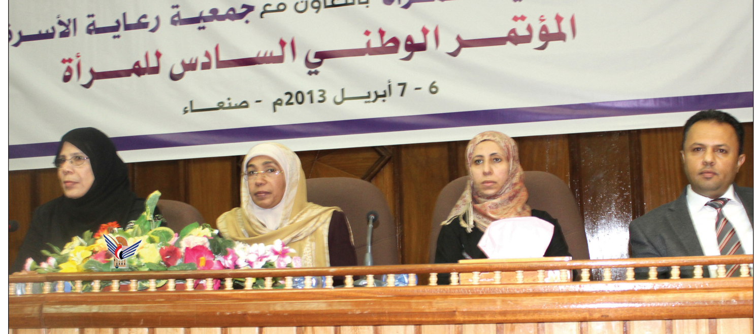
من افتتاح المؤتمر السادس للمرأة

في أن تكون مخرجات المؤتمر، ميثاق شرف تحمله النساء إلى أروقة الحوار الوطني وكذا النساء في خارج الحوار. وأوضح أن انعقاد المؤتمر الوطني السادس للمرأة في ظل التغييرات الوطنية يضع المرأة اليمنية لا سيما القيادات السنوية أمام تحديات جديدة عليهم استيعابها والتعاطي معها بادرار وعوي وبصيرة نافذة تمكن المرأة من أن تكون فعلاً النصف الكامل والمكمل في الحياة. وأضاف " لا شك في أن انعقاد المؤتمر مدعاة للشعور بالفخر والاعتزاز لكوني خلال من الوقوف على الإنجازات التي تحققت للمرأة اليمنية على أكثر من صعيد وتحدي التحديات التي ما زالت حاضرة ويمكن أن تقوض تلك الإنجازات". واعتبر الحوار الوطني محطة فارقة وعلامة بارزة في التاريخ الوطني المعاصر كونه جاء بعد سلسلة من الصراعات والمواجهات بما في ذلك المواجهات التي خلفت آلاف الشهداء والجرحى والمخفيين قسرياً والنازحين الله شاعت أن ينحسر ذلك الصراع ويهددي الفرقاء إلى وسائل حضرية تحقن الدماء وتفضي إلى قواصم مشتركة مهما كان حجم الخصومات لان استمرارها يعني استمرار الخسائر وتقليلها ومحاصرتها عند الحدود يعني تعظيم الفوائد والمكاسب للوطن والمواطن.