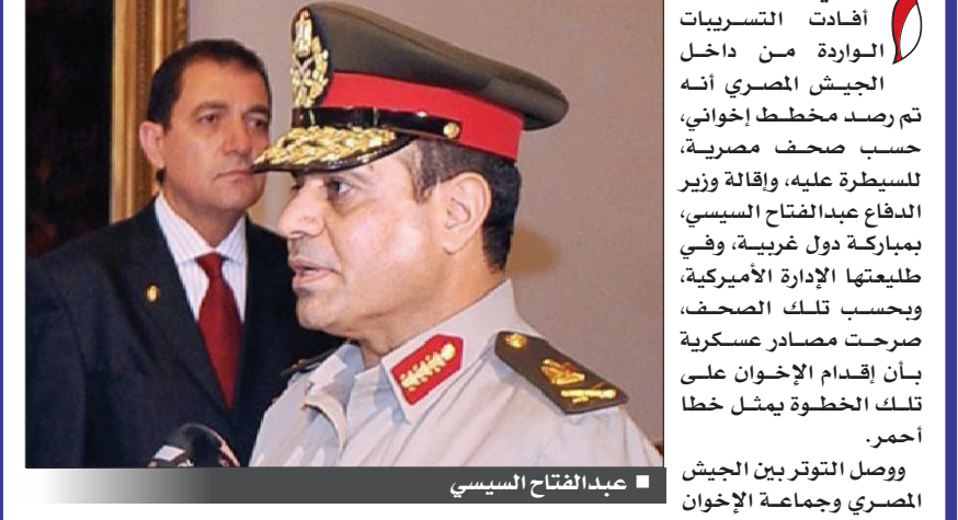
عبد الفتاح السيسي

تولي مرسى الرئاسة. هذه المصادر حذرت من إمكانية ما سمّته دخول مصر في محور الشر بعد التمدد الإيراني الضغوط التي مورست على وزير الدفاع مرسي خلال زيارته إلى باكستان والهند، للإيحاء بأن السيسي قريب من القيادة السياسية. هذا الأمر دفع بغضب الجيش إلى العلن وبهذا الشكل الحاد، يؤشر إلى أن مصر مقبلة، ربما على تطورات أكبر، خاصة في ظل نية المعارضة تجسير انقسامها في سبب الغضب، على حد وصفها، ما يمكن أن يفجر الموقف أكثر، في ما لو ساد العنف المشهد. الدي / العربية نت : أفادت التسريبات الواردة من داخل الجيش المصري، أنه تم رصد مخطط إخواني، حسب صحف مصرية، للسيطرة عليه، وإقالة وزير الدفاع عبدالفتاح السيسي، بمرافقة دول غربية، وفي طليعتها الإدارة الأمريكية، وبحسب تلك الصحف، صرحت مصادر عسكرية بأن إقدام الإخوان على تلك الخطوة يمثل خطأ أحمري. وراصل التوتر بين الجيش المصري وجماعة الإخوان إلى مرحلة الحذرة على خلفية رسائل غير مباشرة متبادلة بين الطرفين طيلة الأشهر الماضية، وأبرزها حديث وزير الدفاع، نهاية العام الماضي، عن انحياز الجيش للشعب المصري، ورفضه العنف، ودعوته لحوار سياسي. فضلا عن ذلك، ارتفعت مصادر الجيش (الإخوان) بتدبير حملة على الإنترنت للنيل من القوات المسلحة، كما أشارت إلى أن جهات عليا، لم تسمها، أمرت بإغلاق ملف قتل ربيع السنّة عشر، وأكدت أن الجيش لن يقبل إزاء السيسي بتكرار سيناريو المشير حسنين طنطاوي والفريق سامي عنان، في إشارة لإقالة ضباط رفيعين بعد