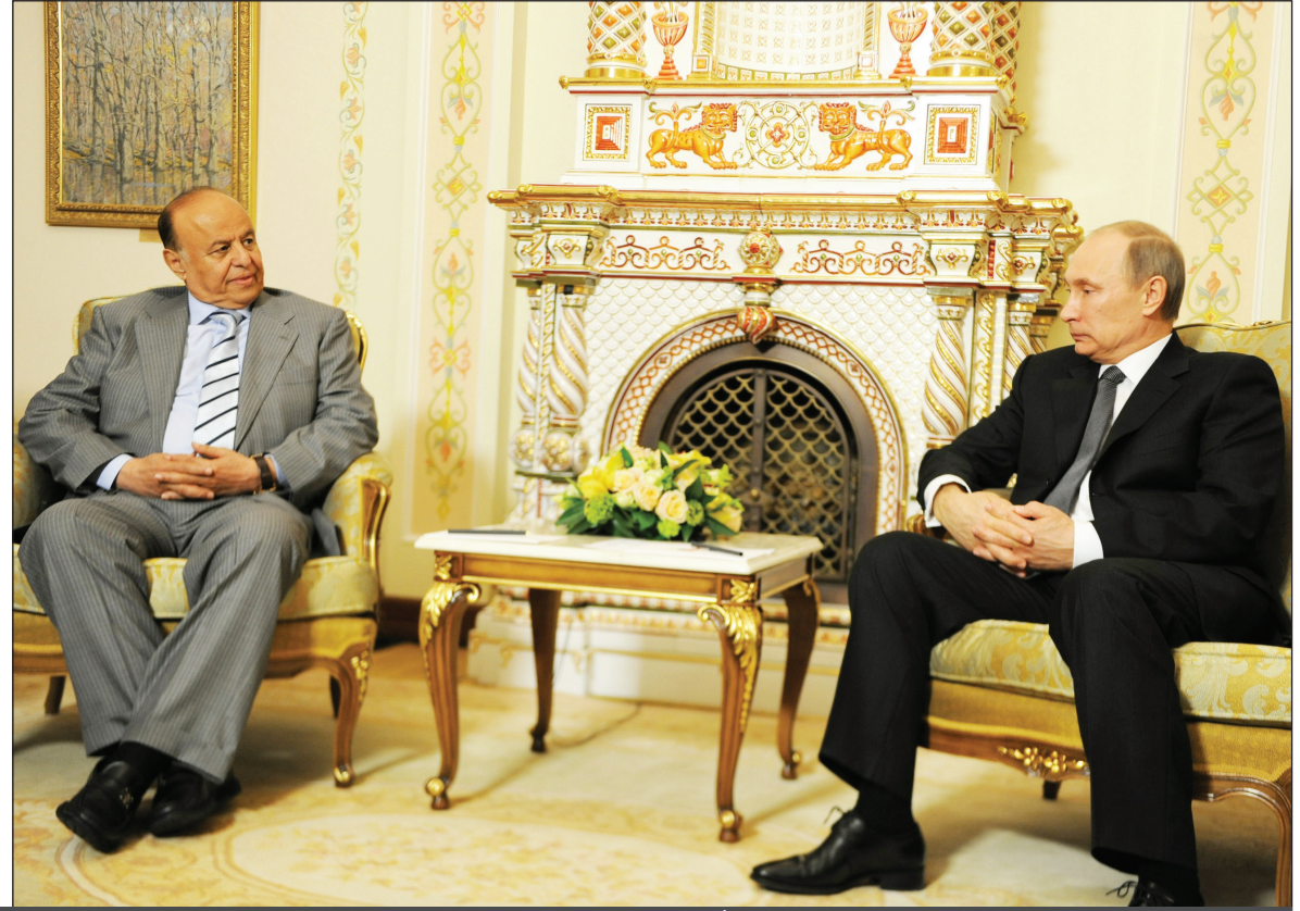
رئيس الجمهورية لدى وصوله إلى العاصمة الروسية موسكو أمس

مع الأحداث التي مرت بالشرق الأوسط في العام 2011 قد عانت من انقسام كبير كاد أن يذهب بالبلاد إلى احتراب أهلي إلا أن اليمنيين اتجهوا نحو الحل السلمي الذي أنتج مبادرة خليجية وانتخابات غير مسبقة أفرزت رئيسا توافقيا أجمع عليه اليمنيون، ونتج عن هذا التغيير