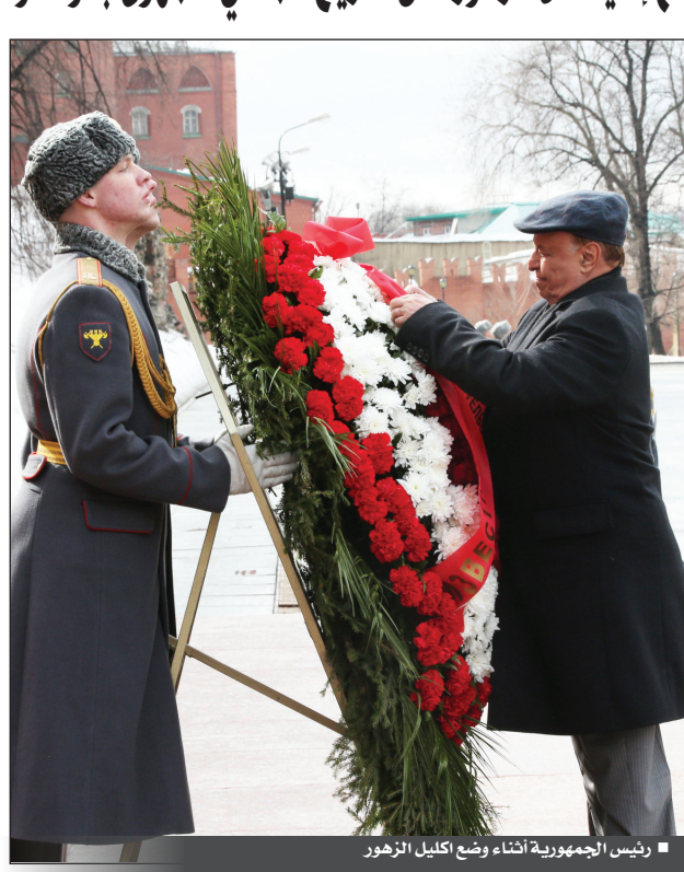
رئيس الجمهورية أثناء وضع إكليل الزهور