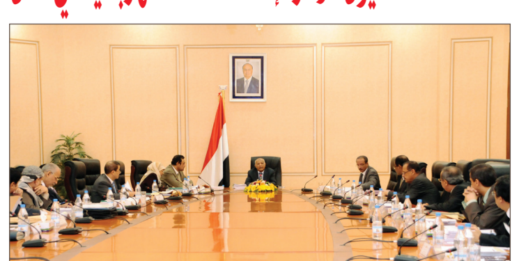
باستدوة يترأس اجتماع مجلس الوزراء أمس

ووافق مجلس الوزراء على مشروع قانون بإنشاء صندوق مكافحة السرطان، والمقدم من وزير الصحة العامة والسكان. وكلف وزير الصحة والشؤون القانونية باستكمال الإجراءات القانونية اللازمة لإصدار القانون. التفاصيل