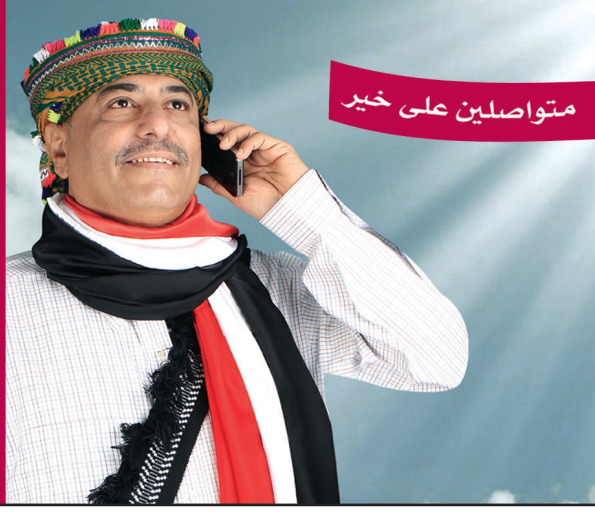
متواصلين على خير