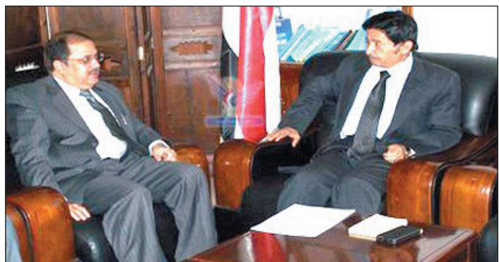
صعدت لعمالي وزير التعليم الفني والتدريب المهني لزيارة الهند لاستكمال الإجراءات المتعلقة بتنفيذ هذه الاتفاقيات على أرض الواقع.

وحرصت وتعتز، وكذا تأهيل (120) من المديرين بالمعهد اليمنية وتدريب مئتين من خلال دورات تدريبية تقام في الهند وأخرى في اليمن. وناقش اللقاء الإجراءات الكفيلة بإنشاء معهد خاص بالأحجار الكريمة، وكذا تجهيز المعهد التقني الصناعي بـ عدن.