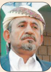
الشيخ صالح الأحمر

عندما يؤجج الإعلام موضوع الغائبين في السعودية، أقول إن كل دولة لها قانونها وكل دولة لها حدودها، لم يكن لليمنيين قبل عام 90، أي قبل، وحدثت أخطاء منا في أزمة الخليج الأولى، وطلبوا منا كفيلاً، مع أن نظام الكفيل يطبق على كافة اليمنيين في السعودية إلا اليمنيين كانوا مستثنين منه إلى عام 90، ومن سابق كان اليمني يصول ويحول في كافة أراضي المملكة العربية السعودية وكانه في اليمن.