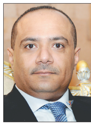
د. واعد باذيب

ذو خبرات وكفاءات يمنية عالية لإبادة حسن النية مع حكومة جزر القمر، موضحاً أنه سوف تتلوه زيارة أخرى لجزر القمر برئاسة الدكتور/ واعد عبدالله باذيب، وزير النقل وكل من وزير الشؤون القانونية الدكتور/ محمد أحمد المخلافي و وزير الخارجية الدكتور/ أبو بكر عبدالله القريبي وشركة الطيران اليمنية والهيئة العامة لصلحة الطيران المدني.