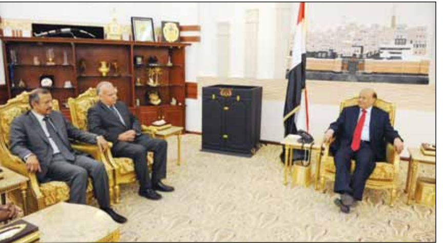
الرئيس لدى استقباله السفير السعودي أمس

■ صنعاء / سبأ : استقبل الأخ الرئيس عبدربه منصور هادي رئيس الجمهورية أمس سفير مملكة السويد غير المقيم لدى اليمن داج يولون دانفليت. وجرى خلال اللقاء مناقشة عدد من القضايا